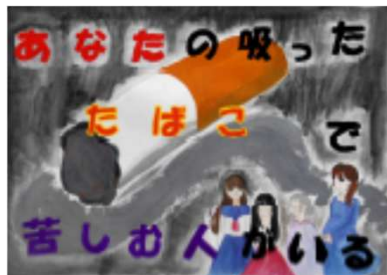
※県内禁煙イベント受賞作品