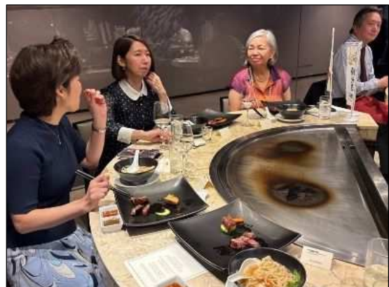
鳥取和牛や梨を使った料理を提供し、来場者が交流を深めた