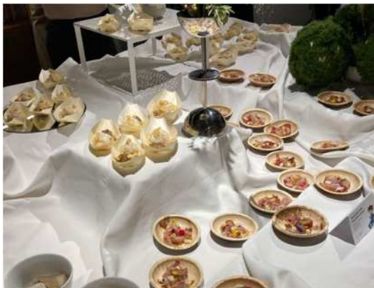
鳥取県食材を使ったイタリアン等料理