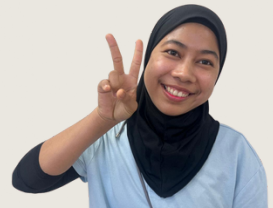
インドネシア出身のライサさん