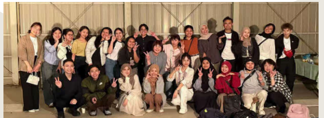
グローバル人材交流会！楽しそう！