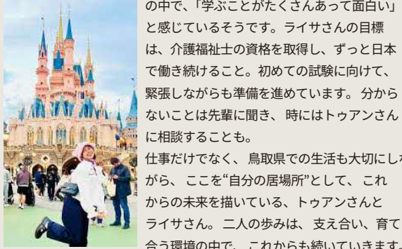
ディズニーランドに行った時のライサさん♡