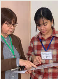
シールを活用しながら指導を行う

まず、入社してすぐに介護の仕事をしてもらうことはありません。最初の1週間は、現場を見学してもらい期間にしています。利用者さんとの関わり方、先輩職員の声かけ、介護の空気感。技術よりも先に、「介護とはどういう仕事なのか」「どんな気持ちで向き合う仕事なのか」を感じてもらいたいと考えています。