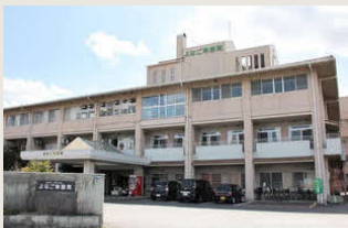
社会福祉法人 こうほうえん よなご幸朋苑

今回取材したのは、鳥取県米子市にある社会福祉法人 こうほうえんさん。ベトナムとインドネシア出身の外国人職員が11名在籍し、他法人からも見学者が訪れるほど、「外国人職員の受け入れ体制が非常に整っている」ことで知られる法人さんです。現在のあたたかい職場環境の裏側には、うまくいかなかった経験も含めて、その「積み重ね」が、今のあたたかい職場環境につながっているのだと感じました！