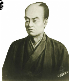
『近世名士写真』

詳細はこちらのHPをご覧ください→ http://www.ishinshi.jp/wordpress/?p=1702