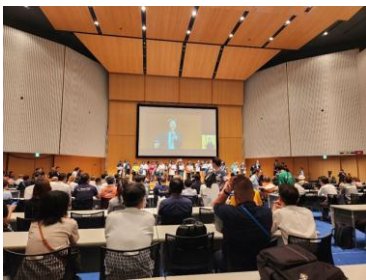
セッション(取組紹介)