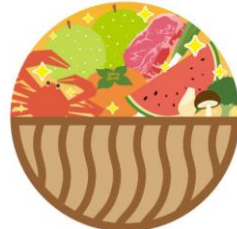
食パラダイス鳥取県 ※写真はイメージです