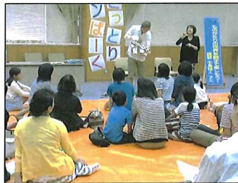
6/14 (日)「読みメンバー in とっとり」の様子