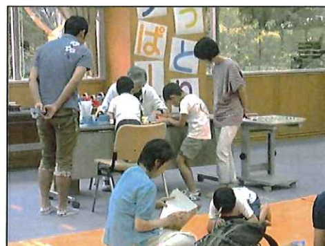
6/13（土）「読みメンぱーく in とっとり」の様子