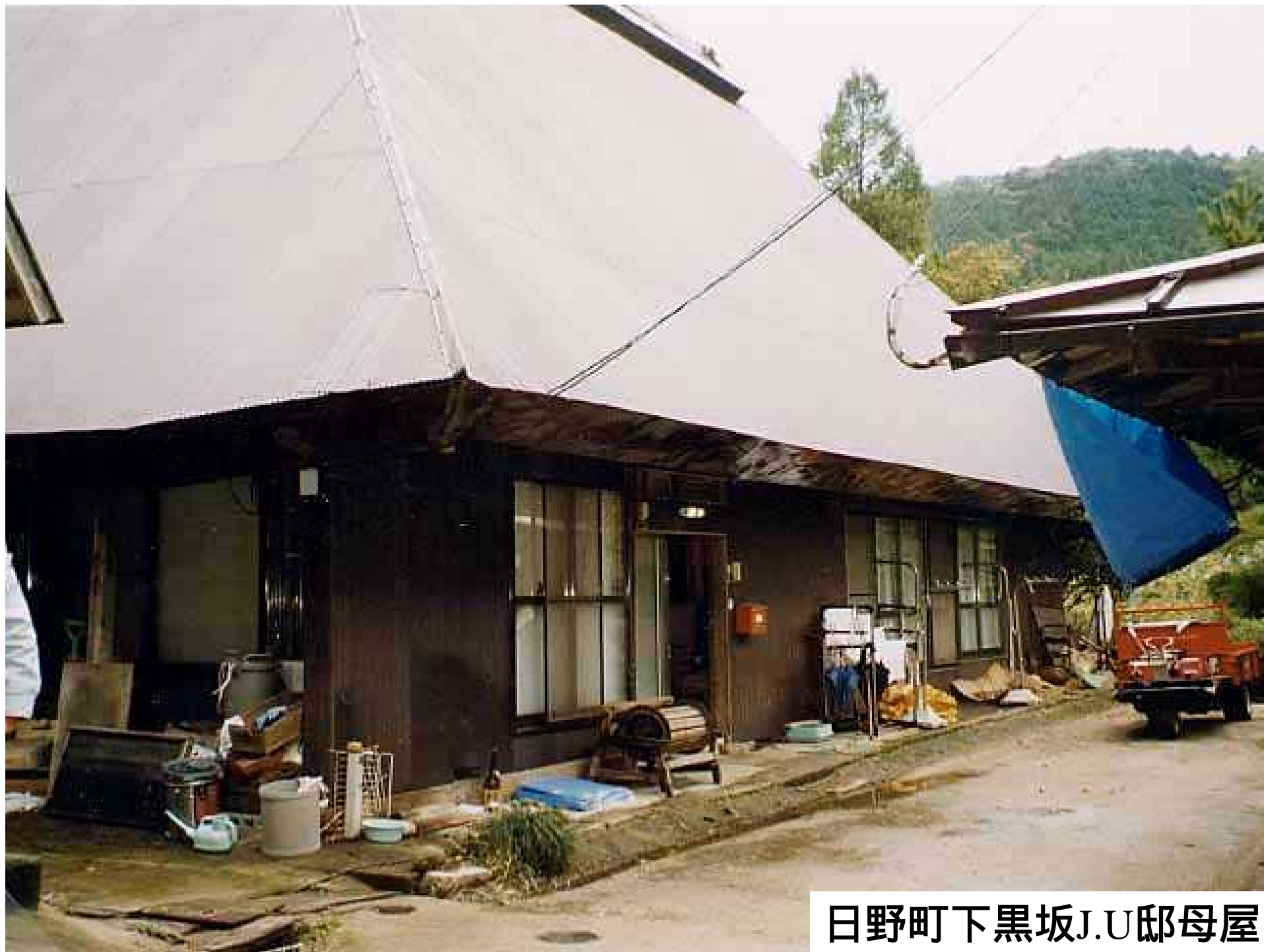
日野町下黒坂J.U邸母屋