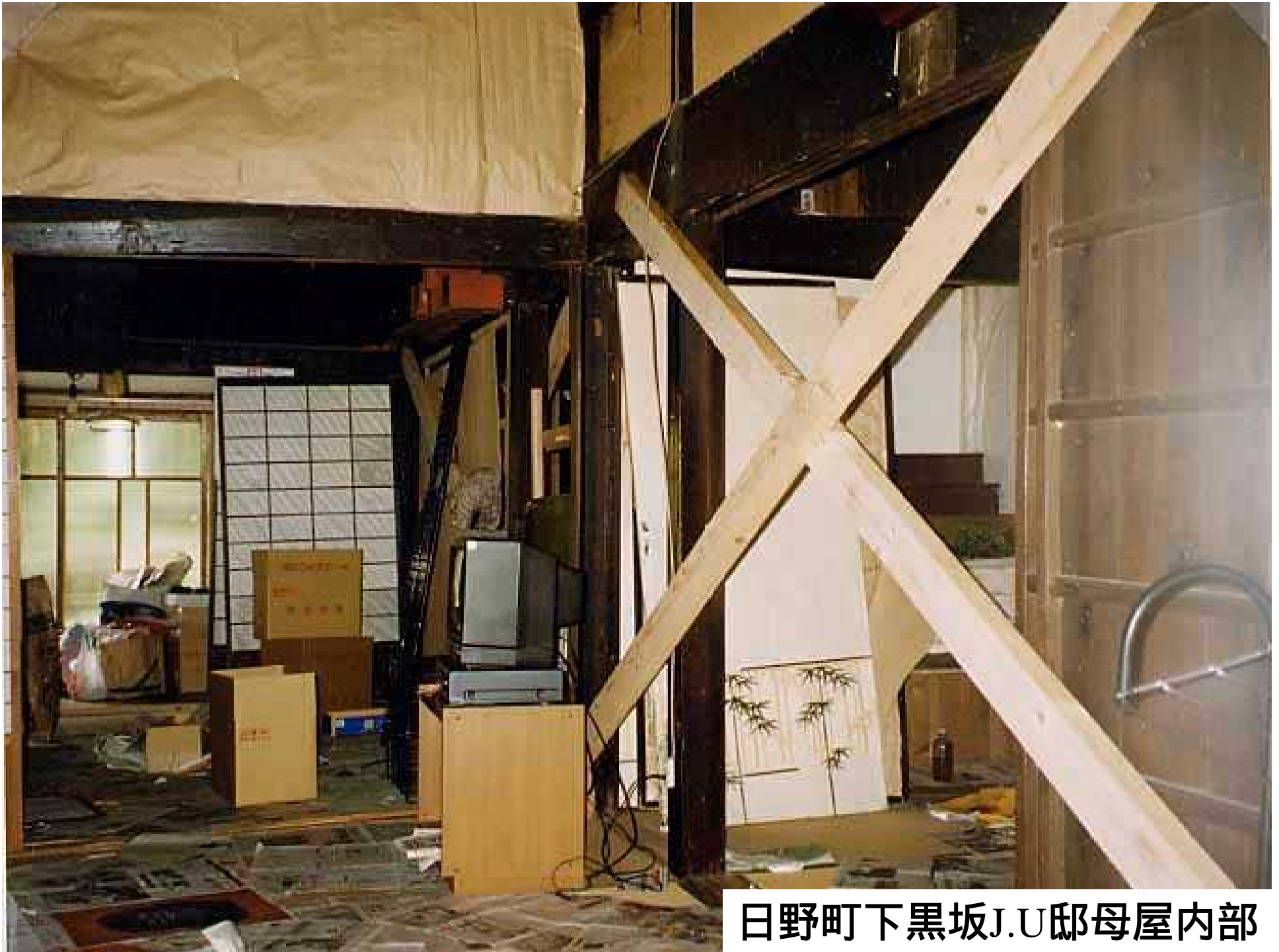
日野町下黒坂J.U邸母屋内部