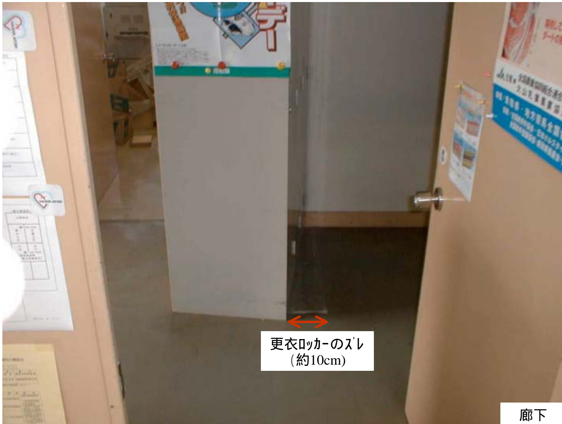
更衣ロッカーのスレ (約10cm)