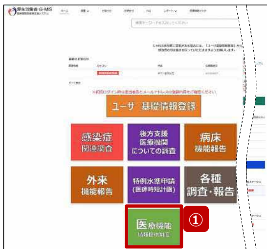
ホーム画面 (病院等)