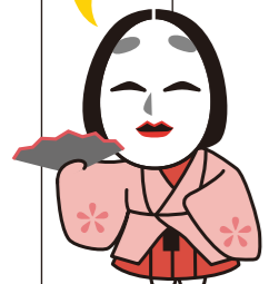
池田家墓所キャラクター いけ子さん