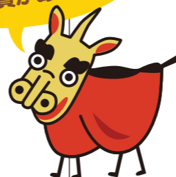
池田家墓所キャラクター きりしくん