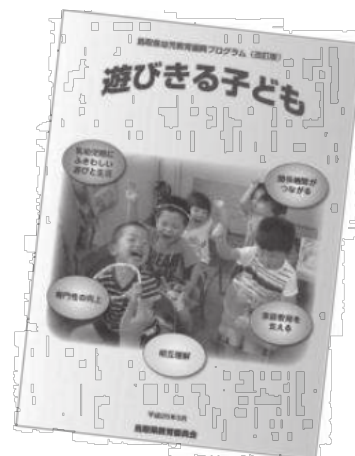
「鳥取県幼児教育振興プログラム」 (平成 25 年 3 月)