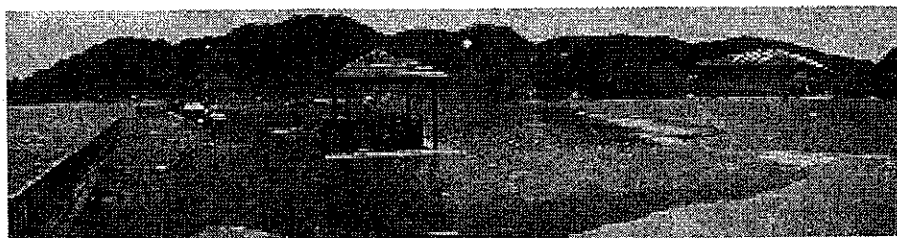
写真: 平成21年6月の浸水状況

供用開始後、年々地盤沈下が進行し、近年は、夏季に多目的広場の一部、テニスコート、園路等が浸水。