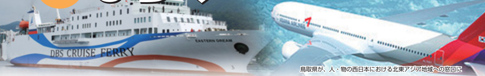
鳥取県が、人・物の西日本における北東アジア地域への窓口