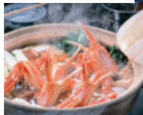
自然・温泉・食など、さまざまな魅力で多くの観光客を呼び込み、「ようこそようこそ鳥取県」を実現します。