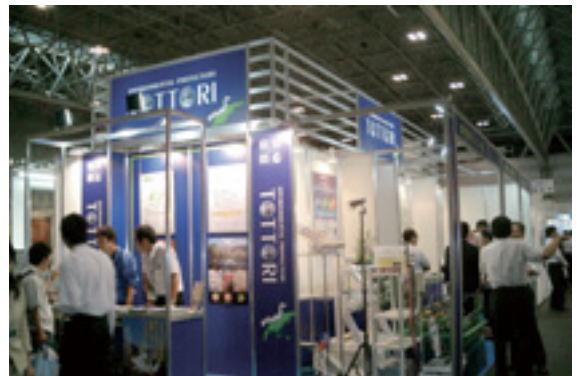
県外へ国外へ打って出る産業を応援します。 （国際総合見本市「メッセナゴヤ」）