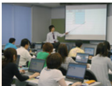
ビジネススタッフ養成研修