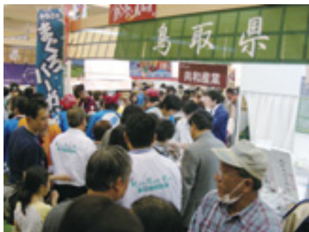
鳥取県の食の魅力を県内外に発信する「食のみやこ鳥取県」を進めます。