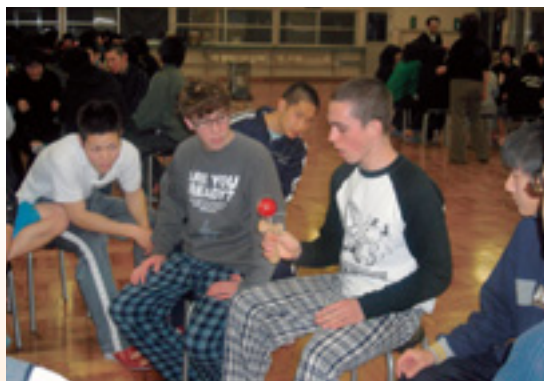
けん玉などの文化を通して交流を深める若者たち (バーモント州ロックポイントスクールとの交流)