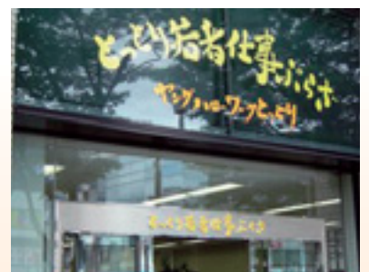
とっとり若者仕事ぶらざ