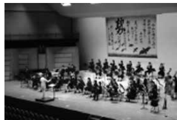
文化部総合芸術祭「翠燦く」