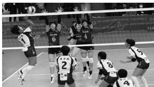
春高バレーボール

科学研究・美術・書道・演劇・茶道・華道・吹奏楽・ESS・JRC・箏曲・放送・写真・文芸・社会問題研究・漫画研究・合唱