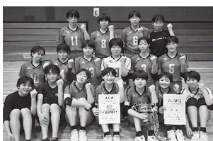
★祝★インターハイ出場！