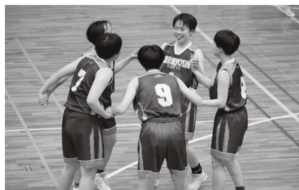
(女子バスケットボール部)