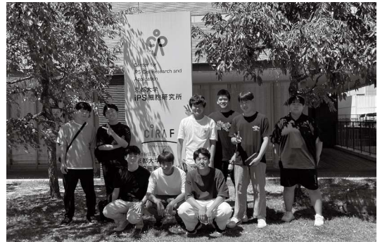
(進学合宿 京都大学にて)