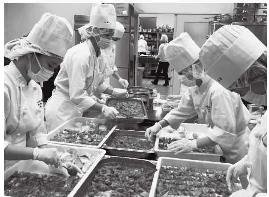
(調理科 集団調理の授業)