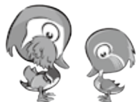
日野高校マスコットキャラクター「オッシー・ドリー」