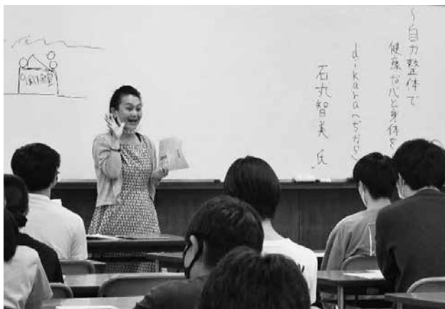
【キャリアアップ講座（進路講演会）】

鳥取大学、神戸学院大学、長崎国際大学、千葉商科大学、美作大学、鳥取短期大学、鳥取看護大学、大阪デザイナー専門学校、神戸ファッション専門学校、鳥取県立産業人材育成センター、松江栄養調理製菓専門学校、ENEOSウィング、サイプレス、東宝企業、マルイ、万翠楼、寺方工作所、丸合、鳥取東伯ミート、米久おいしい鶏