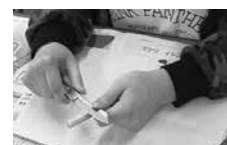
【総合的な探究】 竹細工。ナイフで削って竹箸づくり。