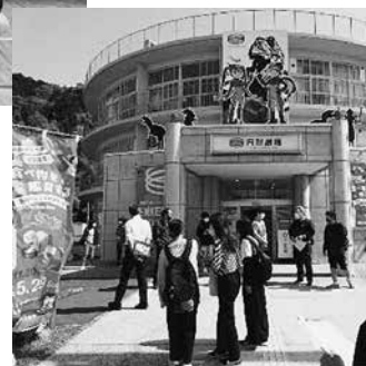
【4月校外研修】 （地域文化学習） 円形劇場