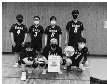
【県定通高校総体】 バレーボール

4月から9月までが前期、10月から3月までが後期の2学期制です。定められた単位を修得すれば9月卒業も可能です。