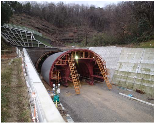
覆工コンクリートが完了した部分の状況です。現在40m区間完了しています。

覆工コンクリートに使う専用型枠「セントル」です。打設箇所に合わせてトンネル内を移動させていきます。