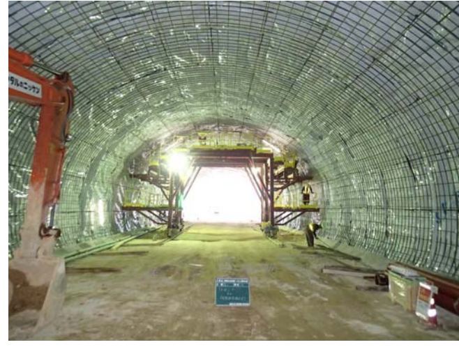
岩倉側では出入り口部の壁(坑門)を作る工事に着手しました。

コンクリートで覆う前にシートを張り、防水処置を行います。あわせて、鉄筋を入れることでより丈夫な構造とします。