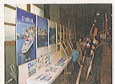
鳥取港振興会も展示を実施