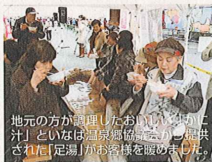
地元の方が調理したおいしい「かに汁」といなば温泉郷協議会から提供された「足湯」がお客様を暖めました。