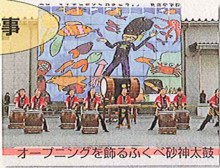
オープニングを飾るふくべ砂神太鼓