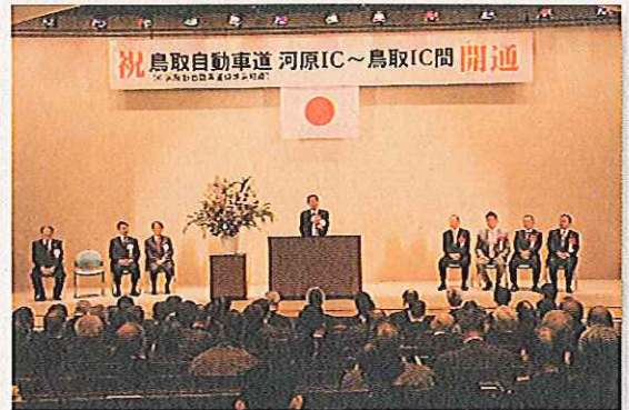
鳥取環境大学で開かれた記念式典