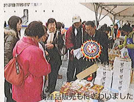
産品販売もにぎわいました