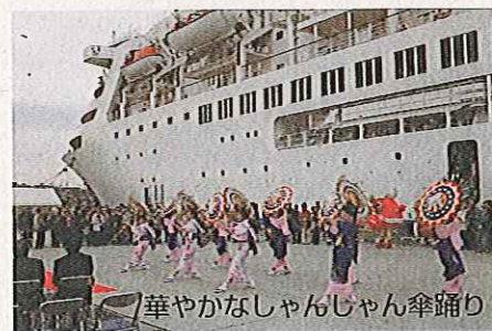
華やかなしゃんしゃん傘踊り