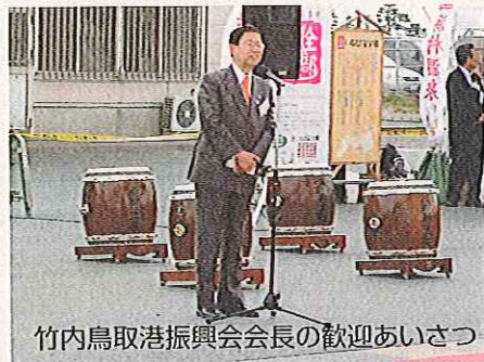
竹内鳥取港振興会会長の歓迎あいさつ