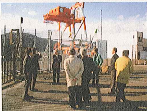
敦賀市・敦賀港貿易振興会から詳しい説明をうけました

先進港の取り組みを参考にしようと、平成21年11月18日(水)福井県敦賀港への視察を実施しました。敦賀港は、日本海沿岸の重要港湾として、ロシアや中国、韓国との貿易を視野に、近畿圏や東海圏の物流獲得を目指すポートセールスを展開されており、取扱貨物量全国42位、日本海側の港では2位の位置を占めています。アジアゲートウェイを目指す鳥取港においても参考になりました。(参加者 鳥取港振興会会員等 10名)