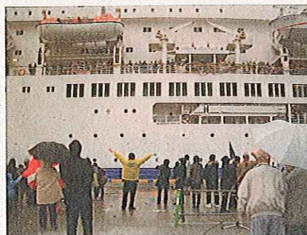
紙テープで感動のお見送り