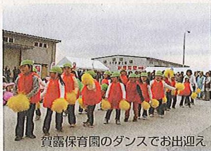
賀露保育園のダンスでお出迎え