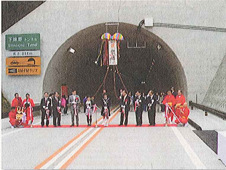
平成22年3月28日に行われた開通式

高速道路新時代を迎え、関西圏との交流がますます活発化していくとともに、北東アジア向けの輸出入で、鳥取港の優位性が高まることが期待されます。