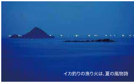
イカ釣りの漁り火は、夏の風物詩

初夏から晩秋にかけて、夜ごうこうと輝く漁り火は、日本海の風物詩です。この漁り火の下で釣り上げられるケンサキイカは地元ではシロイカと呼ばれ、甘みが強く濃厚な味わいが人気の鳥取の夏を代表する味覚です。