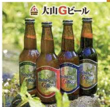
よ米桜酒株式会社 西伯郡伯耆町丸山