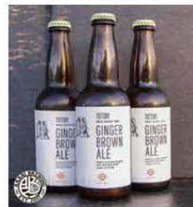
株式会社AKARI BREWING 鳥取市鹿野町今市