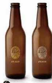
475ビール JAP BREWERY 米子市東倉吉町