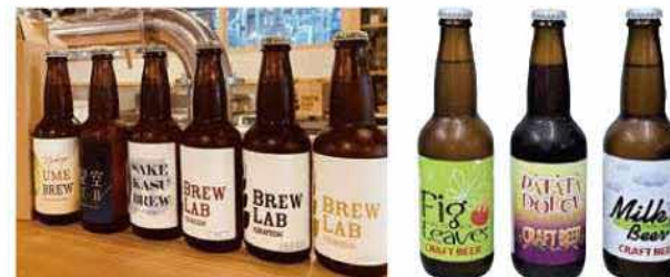
倉吉ビール 倉吉市東仲町