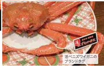
活ベニズワイガニのブランドタグ

令和元年から活ベニズワイガニにブランドタグを付ける取組が始まっています。境港市の飲食店では、ベニズワイガニでは希少な刺身、しゃぶしゃぶなどが提供されています。