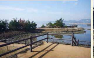
弁天島公園でひと休み