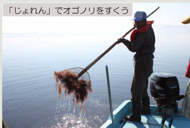
「じょれん」でオゴノリをすくう

地元漁師さんの指導のもと、早速「じょれん」を使って底をすくいあげると、たちまち船上はみずみずしいオゴノリの山。