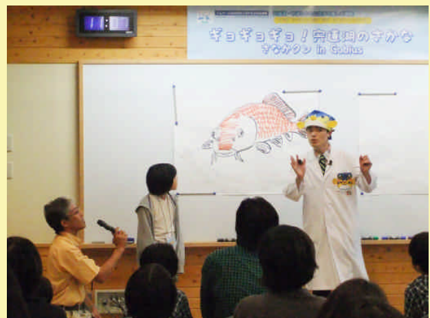
さかなクンの講義(ゴビウス レクチャールーム)

※この講座は、全国モーターボート競走施行者協議会からの拠出金を受けて実施しました。