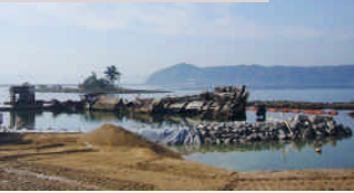
廃船、幻想的な光景