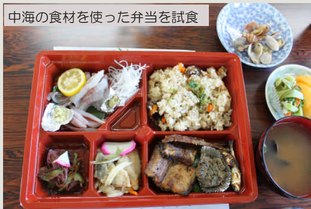
中海の食材を使った弁当を試食

平成23年度から、鳥取県・島根県が連携・協力し、海藻の回収事業、肥料や健康食品等への利活用に係る調査研究を実施する予定です。