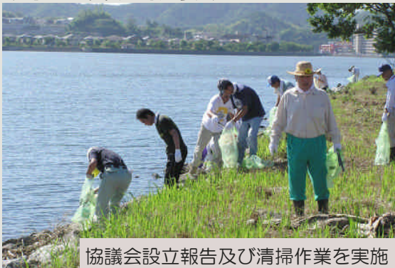
協議会設立報告及び清掃作業を実施