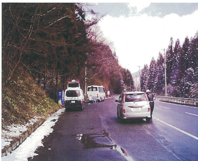
交通部隊による検問