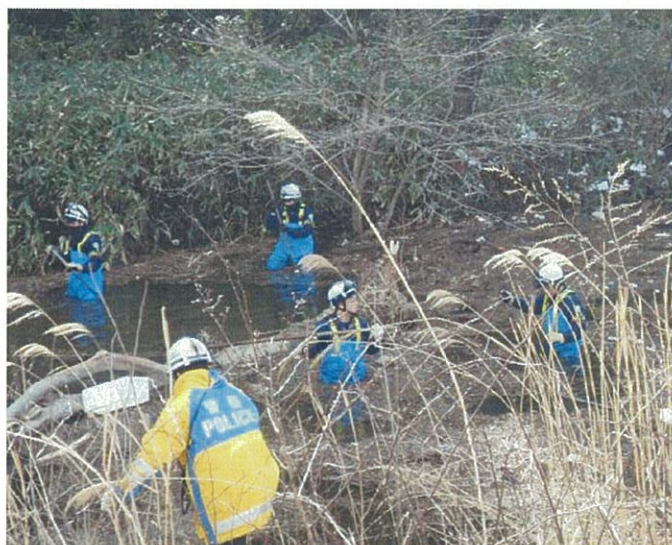
警備部隊による被災者捜索