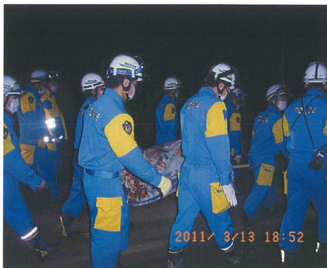
警備部隊による被災者捜索（遺体発見）