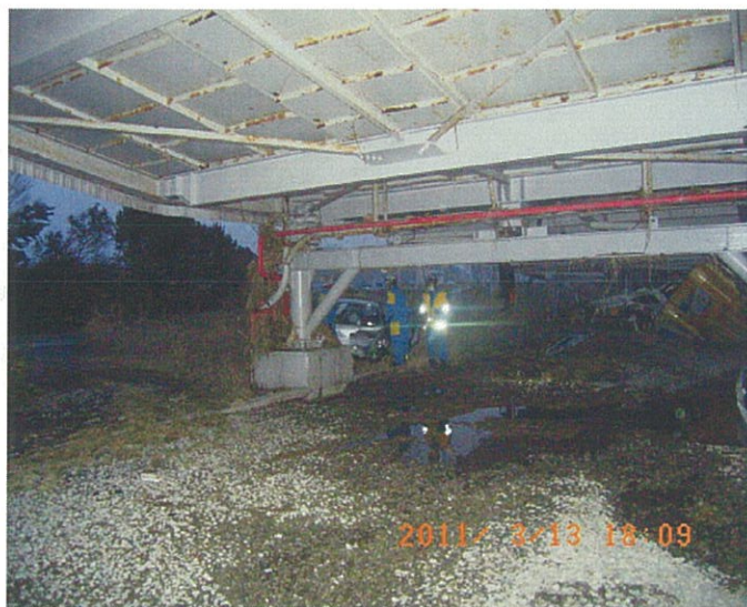
警備部隊による被災者捜索