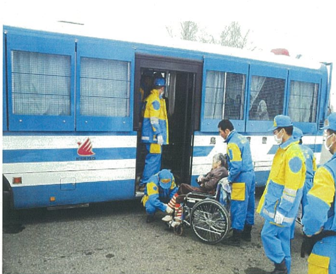
警備部隊による被災者搬送（特養ホーム入所者）