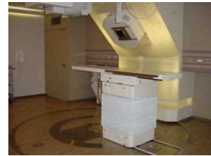
（写真）兵庫県立粒子線医療センター