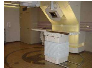
（写真）兵庫県立粒子線医療センター