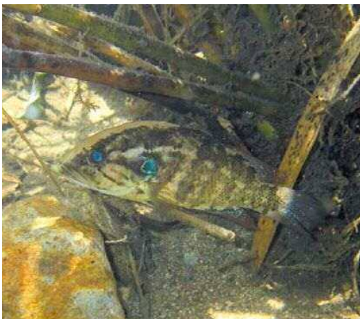
卵を守る雄親 広島県丁川(太田川支流) 2010.8.21