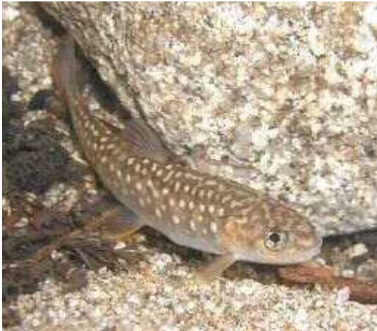
鳥根県斐伊川 2003.5.23

■ 選定理由 ：河川上流域に局所的に生息し、開発や他系統のイワナの放流によって減少の一途をたどっている。