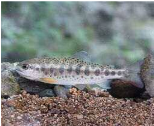
ヤマメ 天神川水系 2010.4月

■ 選定理由 ：他系統のヤマメの放流や、過去に行われた亜種のアマゴ O. m. ishikawae の放流によって、在来の個体群との交雑が起こり、純粋な野生個体群の存続は危機的な状況にある。