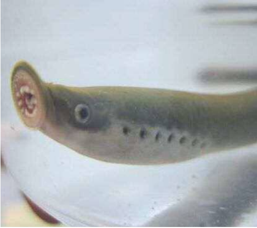
鳥取市国府町袋川

■ 選定理由 ：河川の中流から下流にかけての、限られた環境下でなければ生息できないが、近年の河川工事や水質悪化で生息地が失われている。