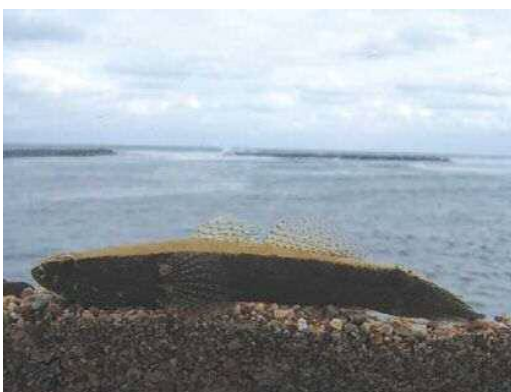
旧袋川産 2010.11.23