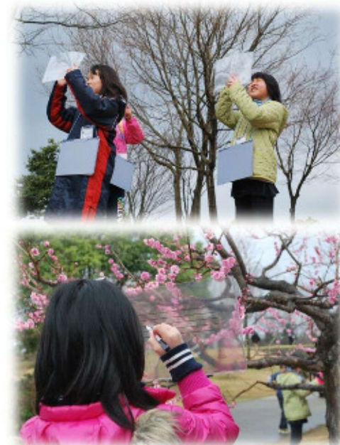
【採譜の様子】(花回廊にて)