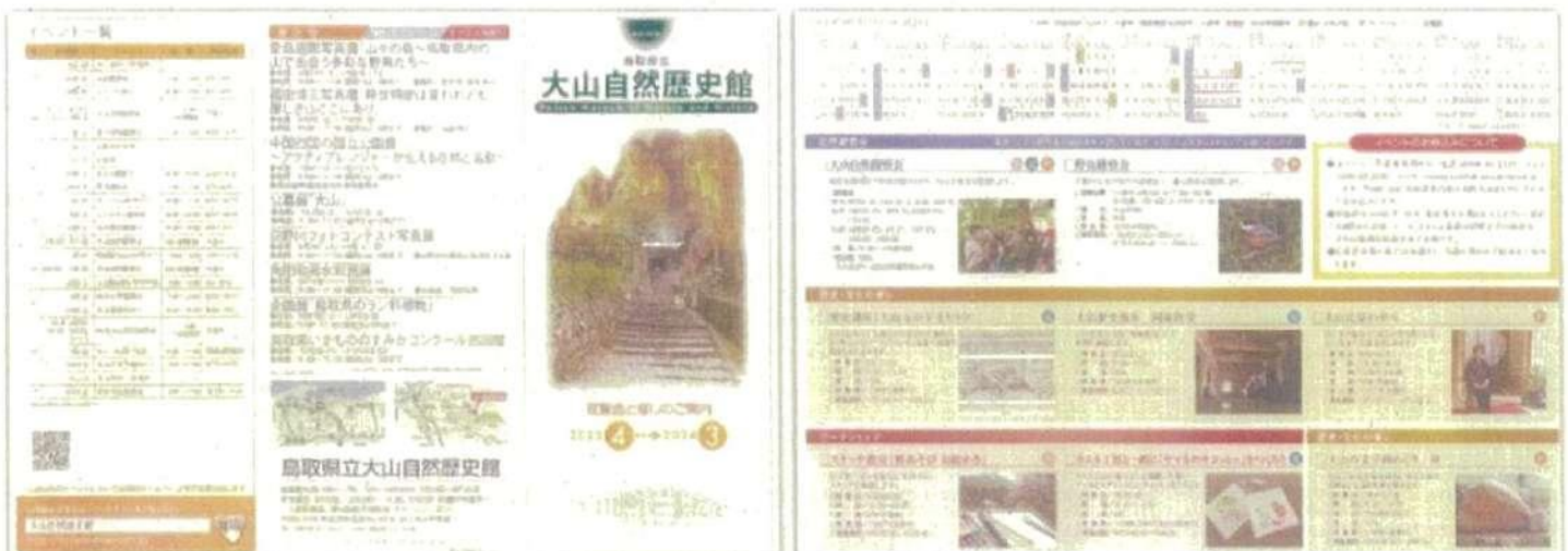
2023年度イベントカレンダー