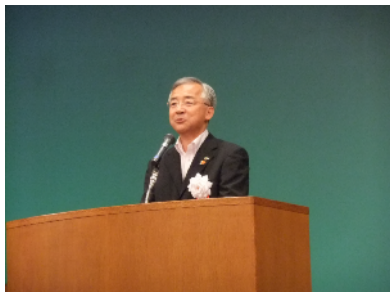
大会長挨拶 横濱教育長