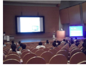
B フォーラム〔学校司書〕湖陵高校 春日先生