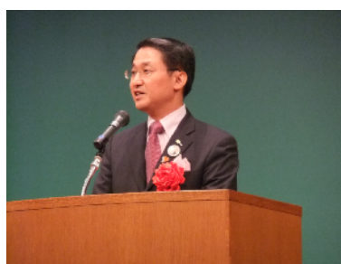
来賓祝辞 平井知事