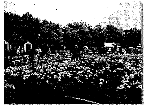
(東郷湖羽合臨海公園)

鳥取県生活環境部公園自然課 (〒680-8570 住所記載不要) 電話 0857-26-7199 / ファクシミリ 0857-26-7561 電子メール kouenshizen@pref.tottori.jp ホームページ http://www.pref.tottori.lg.jp/dd.aspx?menuid=45312