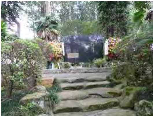
日本移民開拓先没者慰霊碑

慰霊碑に献花して、亡くなった移民の皆様の御霊に哀悼の誠を捧げた後、慰霊碑の地下にある霊廟に入り、祀られた平和慈母観世音菩薩木像、地藏菩薩像、過去帳を前に焼香し、手を合わせて冥福を祈り、記帳した。本橋会長に加え、連合会の役員の方々に参列いただいたが、参拝したこと、なかんずく参拝から訪伯の活動を始めたことを大変喜んでいただいた。