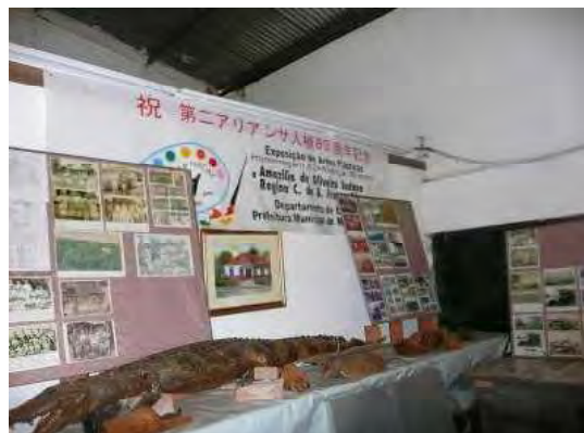
同氏が収集している移住に係る資料