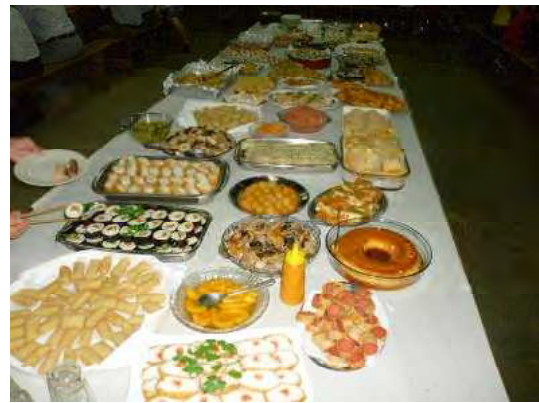
歓迎会の料理は、自治会婦人部の 心のこもった手作りだった。

そういう意味で、鳥取県議会からも何度も議員団が訪れていることも、意味が深いと感じた。自治会女性部の皆さんの手作りの料理に舌鼓を打ちつつ、自治会の皆さんから、ここでの暮らしの様子、鳥取への思いなどを聞かせて頂いたが、「母県」という言葉が何度も繰り返され、「鳥取県は皆さんのことを忘れていない」というメッセージを発信しなければいけないとも強く思った。また、鶏肉は日本へ輸出しているものの、牛肉の輸出が出来ないことを悔やんでおられる方も少なくなかった。口蹄疫は人間では発症しないが、日本は口蹄疫の発生した国からの牛肉および乳製品の輸入を禁止しており、ブラジルや隣国のアルゼンチンでは口蹄疫を発症する牛が後を絶たないため、これだけ畜産が盛んでありながら、全く輸出できないのだという。