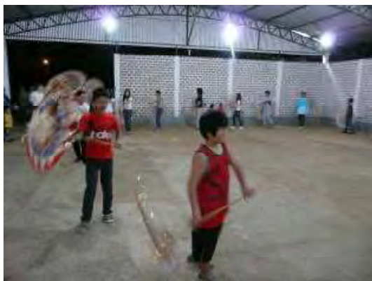
訪問団と傘踊りを踊る日本語学校の生徒達

アリアンサ鳥取村日本語学校の生徒と訪問団はしゃんしゃん傘踊りの輪をつくり、「ふるさと」をみんなで合唱して歓迎会はお開きとなった。訪問団は2名ずつに分かれ、村民の方の自宅にホームステイさせていただいたが、各家庭でも歓迎され、様々な話を深夜まで聞かせて頂いたうえ、手作りの朝食をいただくという温かい歓迎を受け、感謝に堪えない。改めてお礼を申し上げたい。