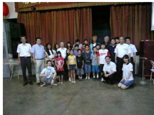
訪問団と日本語学校の生徒達