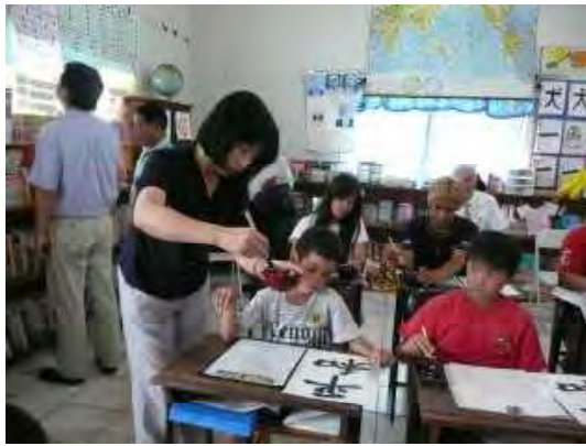
生田次長による習字の授業