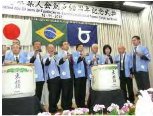
記念祝賀会での鏡開き