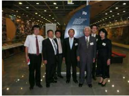
ブラジル移民資料館を訪れた訪問団

ブラジルで食べられる野菜の多くは日系移民が持ち込んだものであることも初めて知った。生野菜を食べる習慣がなかったブラジルで、気候に適合するよう失敗を重ねながら品種や栽培技術の改良を行った結果、野菜サラダが普通に食卓に並ぶようになった経緯などの展示を見つつ、日系人はブラジルにとって大きな存在感のあることを改めて認識した。