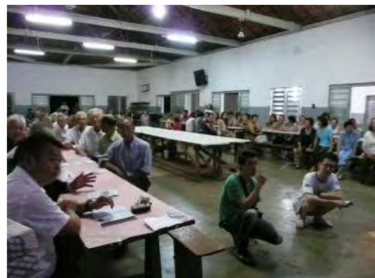
歓迎会に参加した村民の皆さん