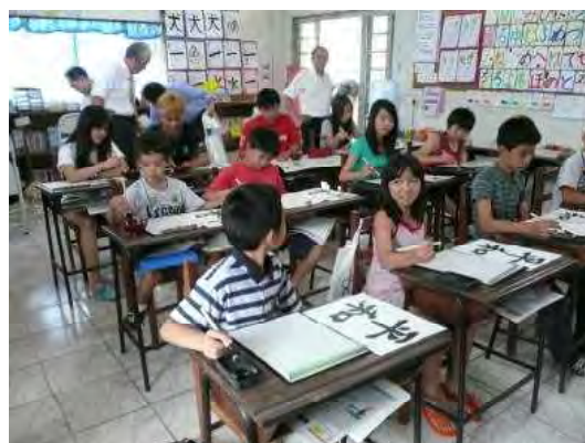
出席した生徒達（12名）