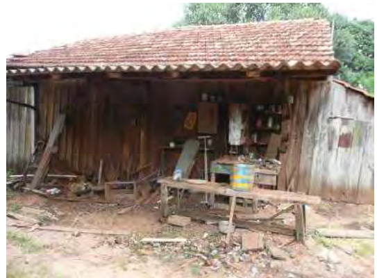
入植直後に住居ができるまで住んでいた建物

第二アリアンサ鳥取村では移住した当時の建物がある一角を「村の開拓者子孫公園」として整備する構想が持ち上がっていた。アリアンサへの移住者が移住直後に家を構えるまで仮住まいとして住んでいた建物や、移住者の世話をしていた組合職員が住んでいた小屋を、当時の姿に戻し、史料などを展示するとともに、アリアンサを出て、サンパウロやリオ・デジャネイロで暮らしている子孫たちがアリアンサに帰ったとき、集う場所にしたいということだった。