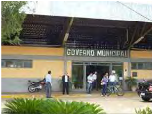
ミランドポリス郡庁舎

ミランドポリス郡役所はバスセンターと同じ建物の中にあった。郡役所というより、村役場というような素朴な感じの庁舎だった。ミランドポリス郡は面積約918km 2 、人口2万7,000人。富山県高岡市と友好都市提携をしている。日本移民の入植地でもあり、多くの日系人が暮らしており、これまでに2人の日系郡長が誕生している。