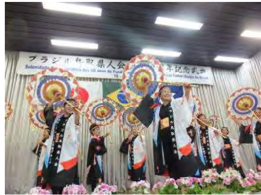
祝賀会での芸能披露

会場の外では、ガーデンパーティーのような雰囲気でも、県人会員や関係者の皆様と様々な話をさせていただいたが、県費での留学や研修を体験した30代、40代の方々の話が印象的だった。