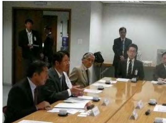
福嶋総領事（左端）・坪井領事（中央）