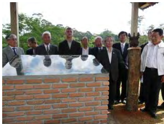
植樹協賛者の名前が刻まれたプレート