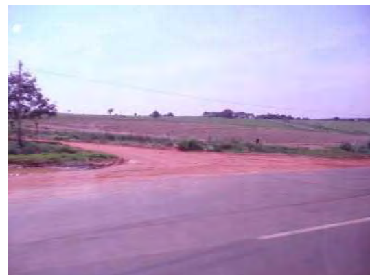
アリアンサへ向かうバスの車窓にて 見渡す限りの農場