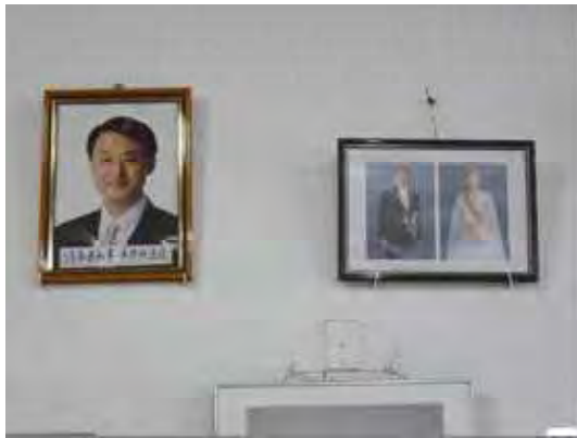
自治会館には平井知事の写真が両陛下 の写真と共に掲げられていた。