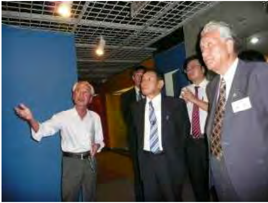
ブラジル移民資料館にて説明をうける