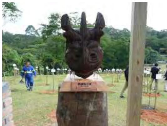
贈呈された麒麟獅子の頭

国名も、この木に由来する。このため、知事の木は、どうしても、ブラジルの木でなければならないと県人会の皆さんがこだわられたため、知事の木は苗木の搬入が遅れ、関係者がヒヤヒヤする一幕もあったが、無事、皆さんと植樹を終えた。