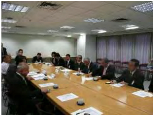
在サンパウロ日本国総領事館での意見交換

農業、政治、インフラ整備等の事項について意見交換を行ったが、ブラジルが経済のパートナーとして非常に重要であることを改めて確認した。