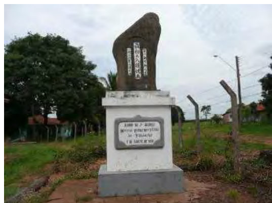
第二アリアンサの最初の入植地点を示す記念碑