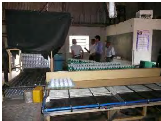
鶏卵の洗卵する機械

メインは養鶏で、1万3,000羽を飼育されており、鶏卵を出荷されている。鶏舎の屋根にはスプリンクラーが設置されていた。気温が上昇したときには散水して、鶏舎を冷やすのだという。養鶏の他に50ヘクタールの牧場で100頭の牛も飼育されていた。