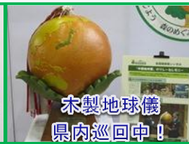
木製地球儀 県内巡回中！