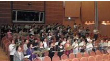
▲10月7日に開催された合唱の練習の様子