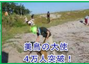
美鳥の大使 4万人突破！