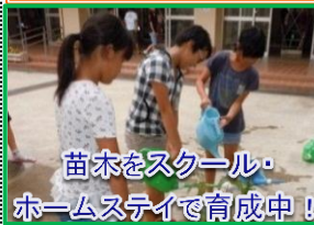
苗木をスクール・ホームステイで育成中！