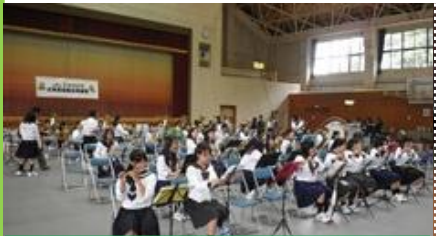
▲10月6日に開催された吹奏楽の練習の様子