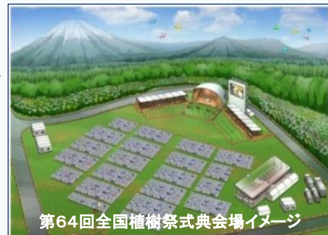
第64回全国植樹祭式典会場イメージ