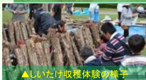
▲しいたけ収穫体験の様子