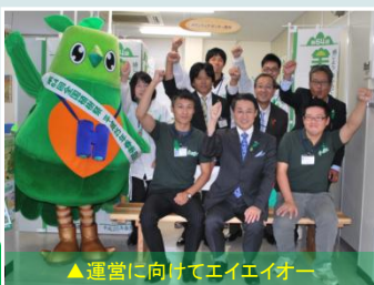
▲運営に向けてエイエイオー