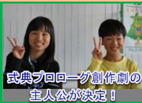
式典プロローグ創作劇の主人公が決定！