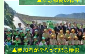
▲参加者がそろって記念撮影