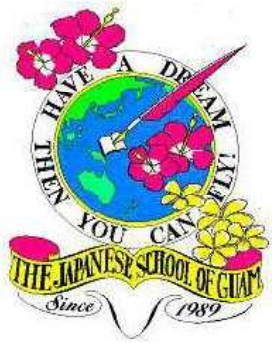
【グアム日本人学校の シンボルマーク】