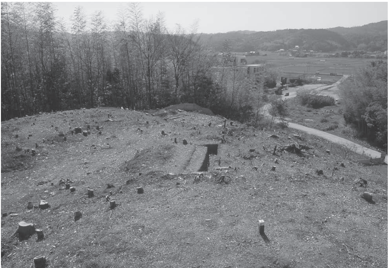
2. 21号墳(左奥)・29号墳(中央)調査前状況(東から)