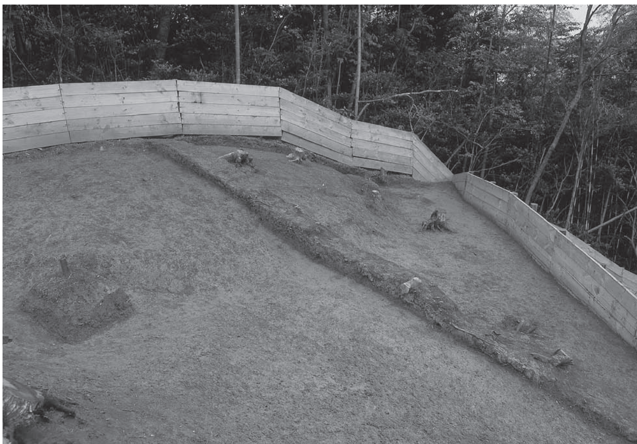
1. 20号墳流土堆積状況(北東から)