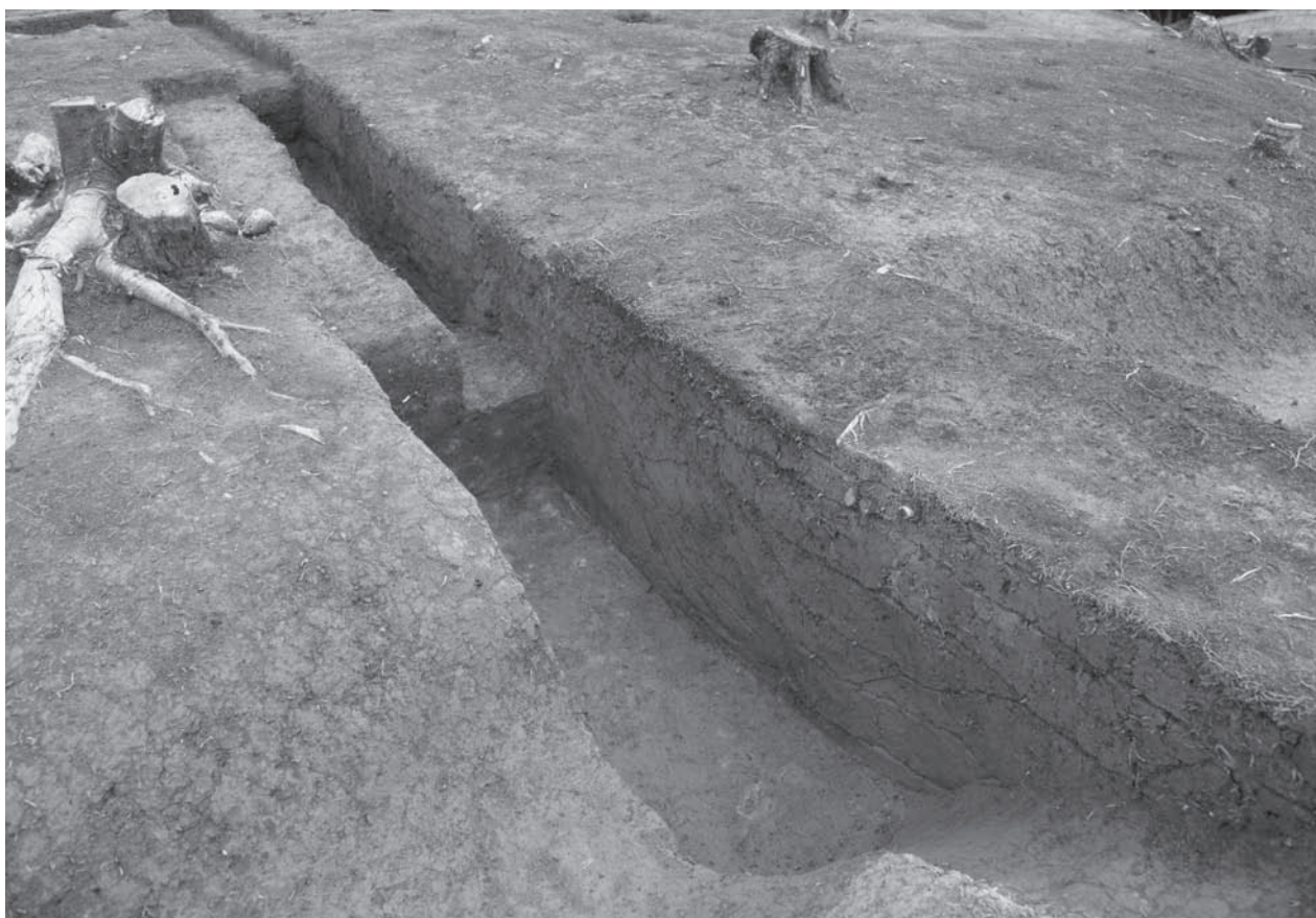
1. 21号墳北側周溝土層断面 (北東から)