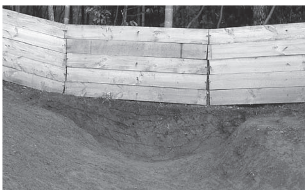
2. 20号墳周溝土層断面(北から)