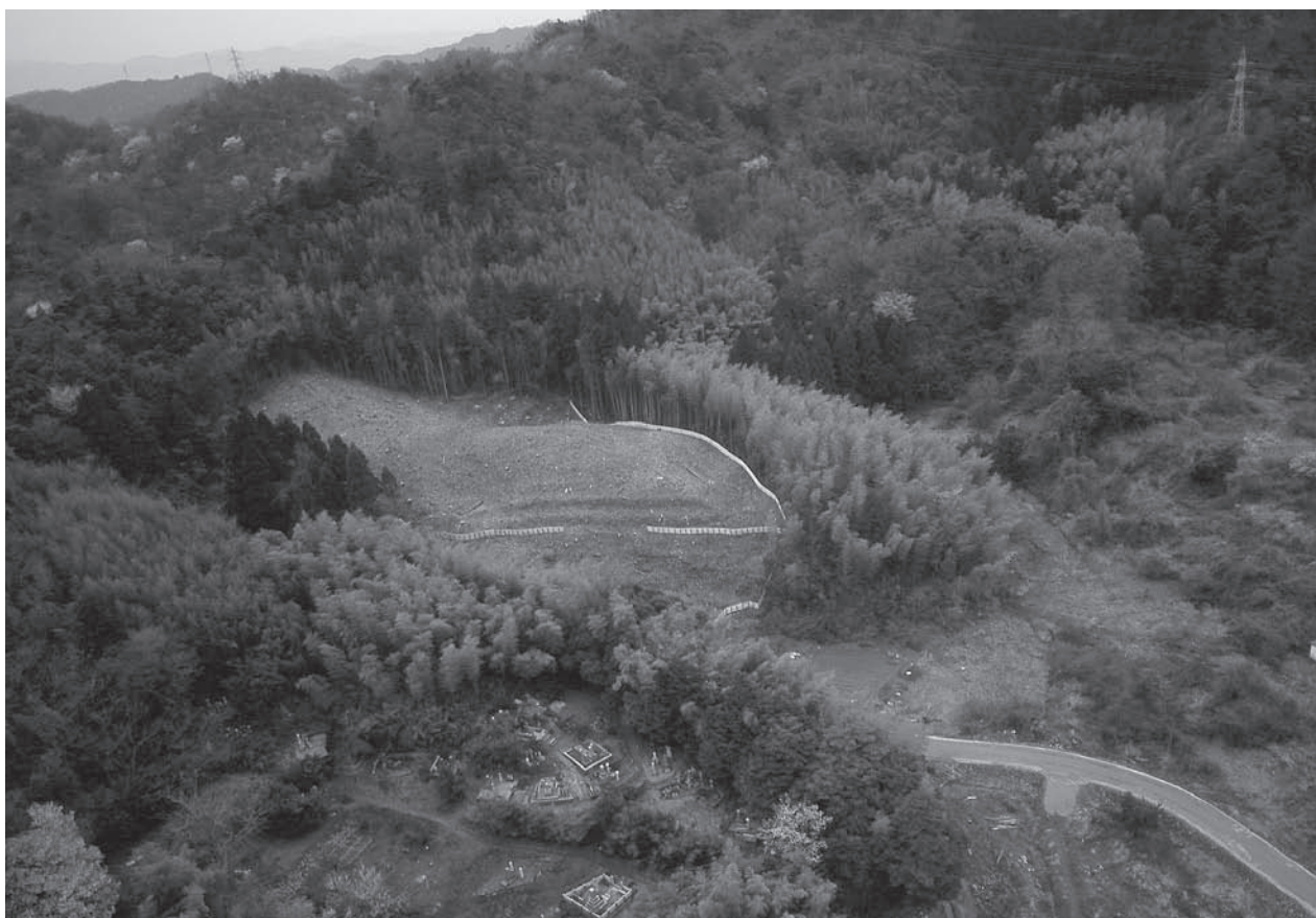
1. 調査地周辺空撮(北西から)