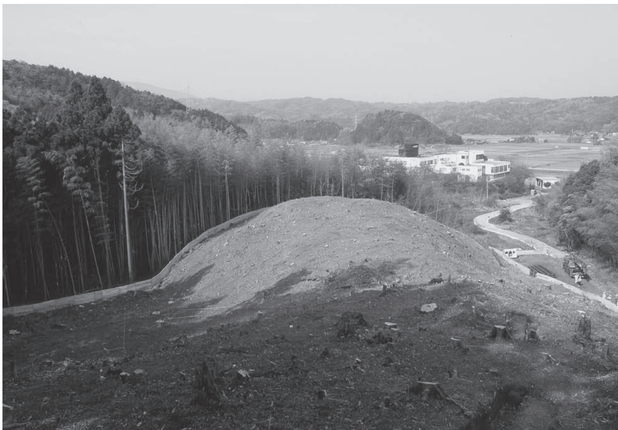
2. 調査地西側調査前状況(南東から)