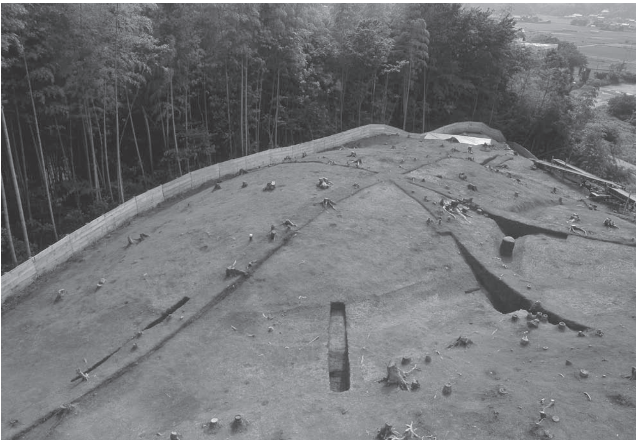
2. 21号墳新段階墳丘流土堆積状況(北東から)