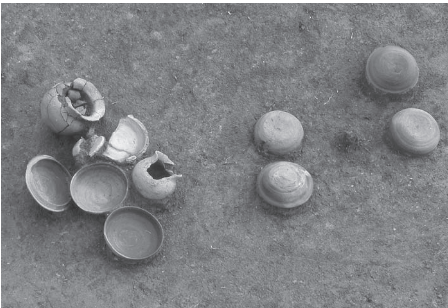
3. 21号墳第3主体部遺物 出土状況(東半 北から)