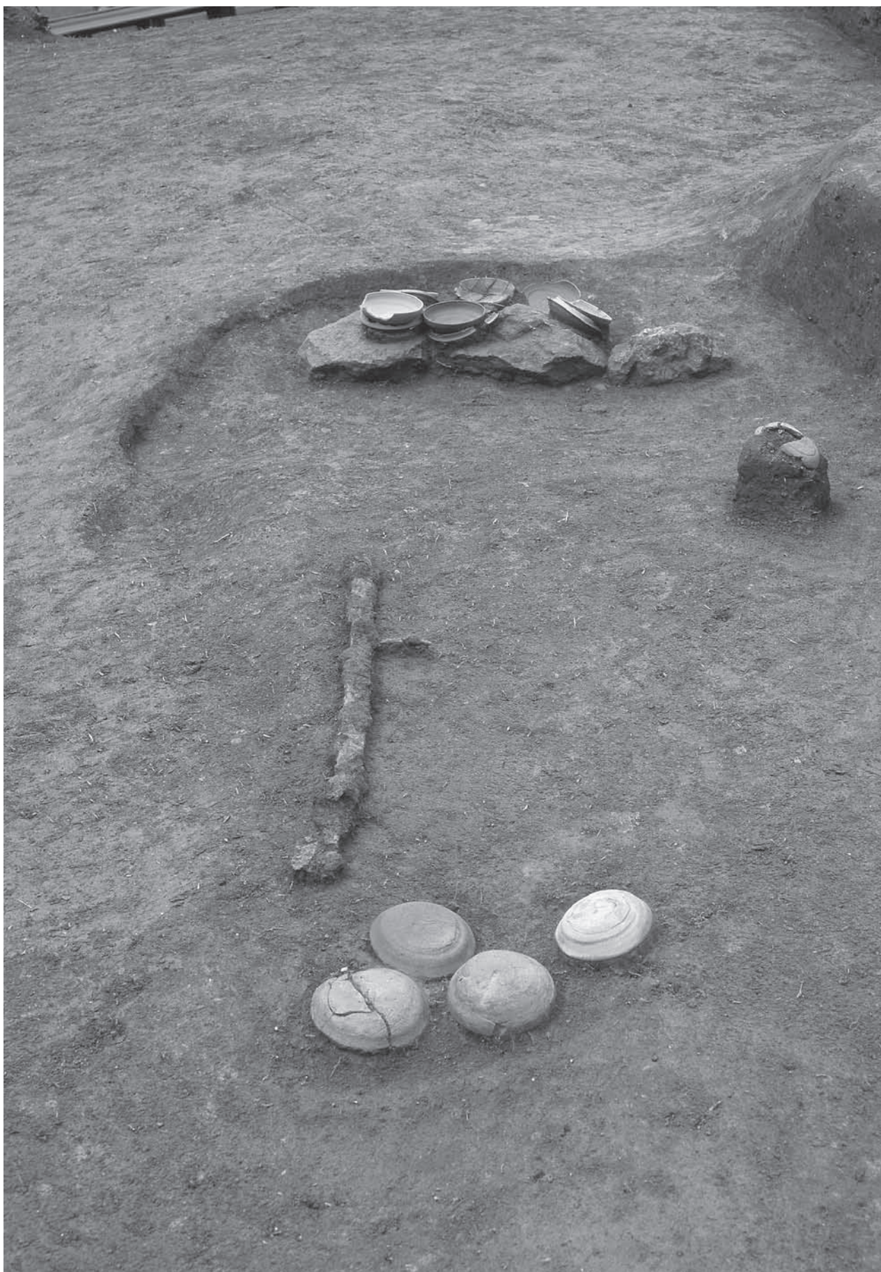
21号墳第1 主体部遺物出土状況(東から)