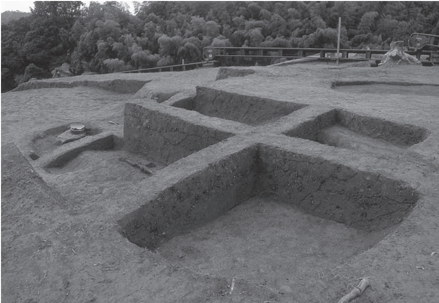
1. 21号墳第1主体部土層 断面(南東から)