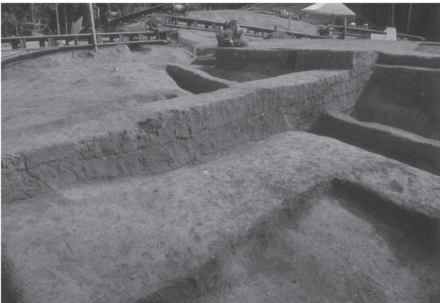
2. 21号墳第3主体部土層 断面(南西から)