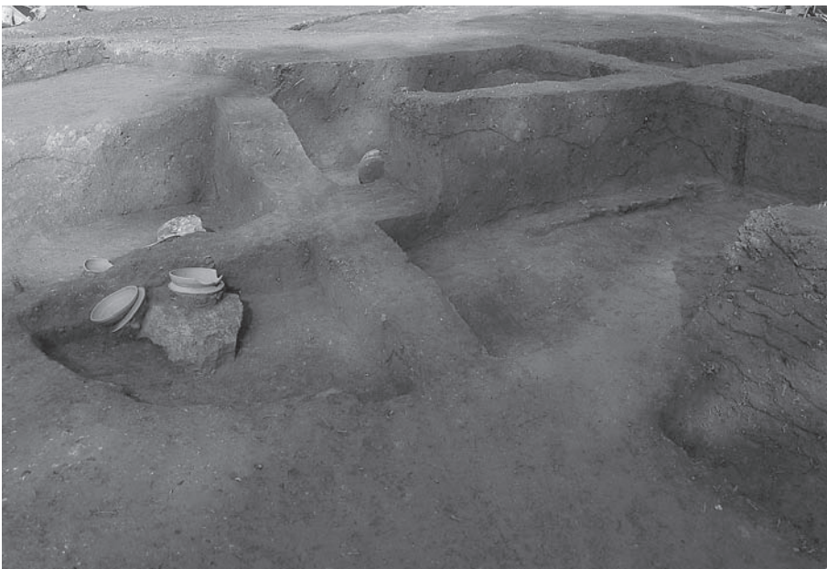
2. 21号墳第1主体部土層 断面(南西から)