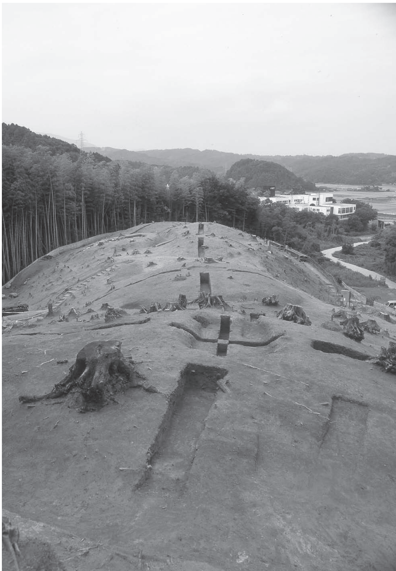
古墳群全景(東から)