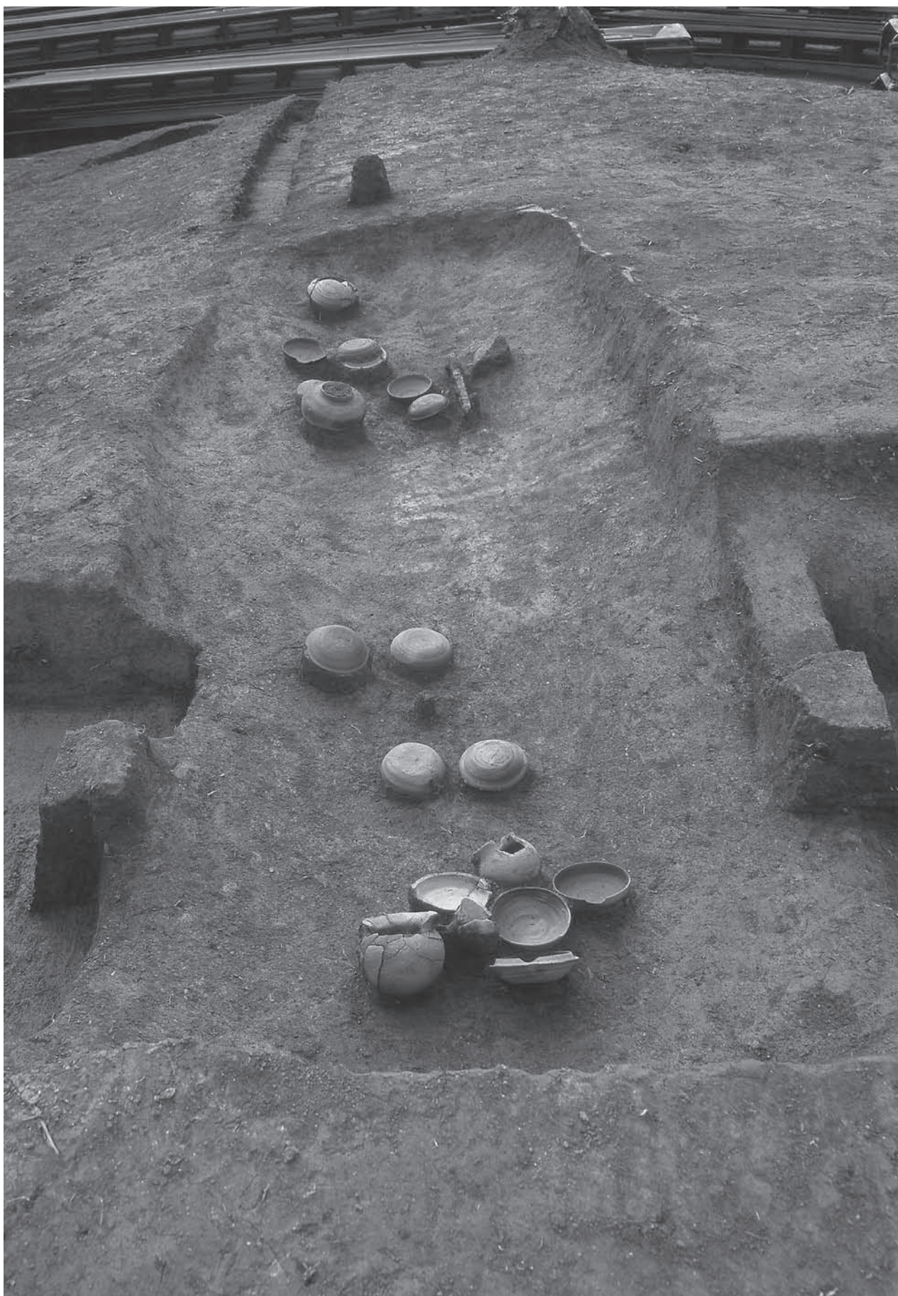
21号墳第3主体部遺物出土状況(東から)