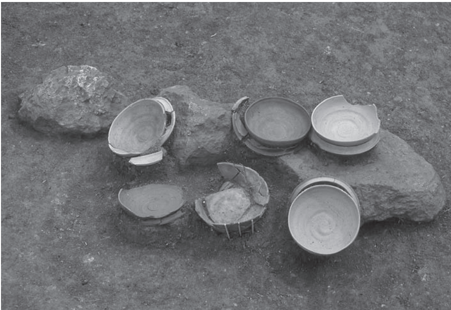
2. 21号墳第1主体部遺物出土状況(西から)