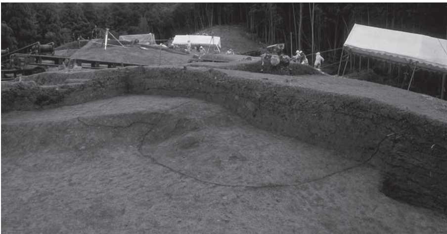
4. 21号墳新段階盛土断面 (南西から)