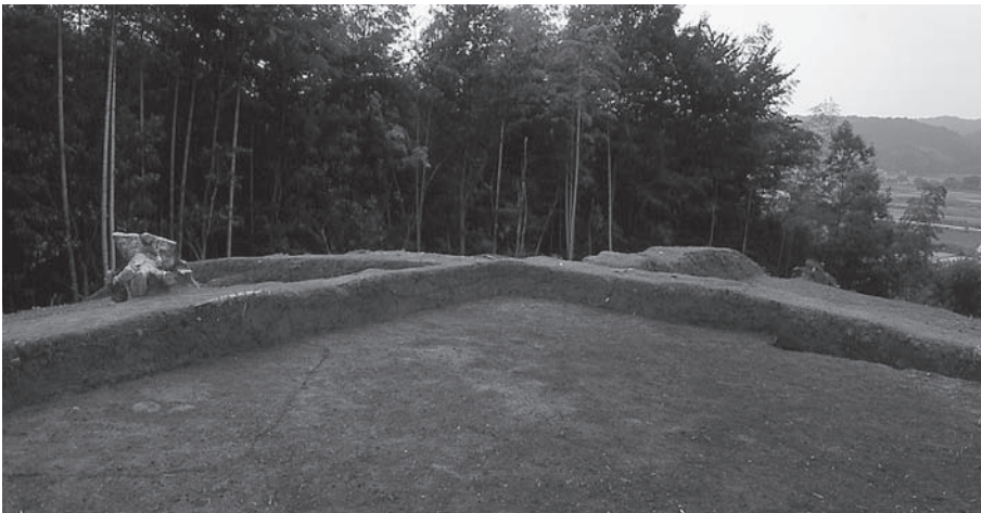
3. 21号墳新段階盛土断面 (北東から)