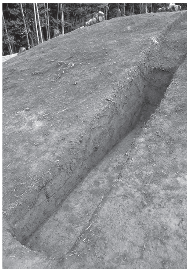
4. 21号墳東側断ち割り(北東から)