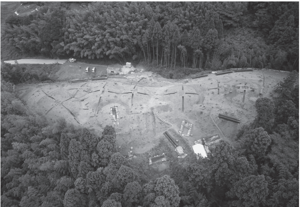
2. 古墳群全景(南から)