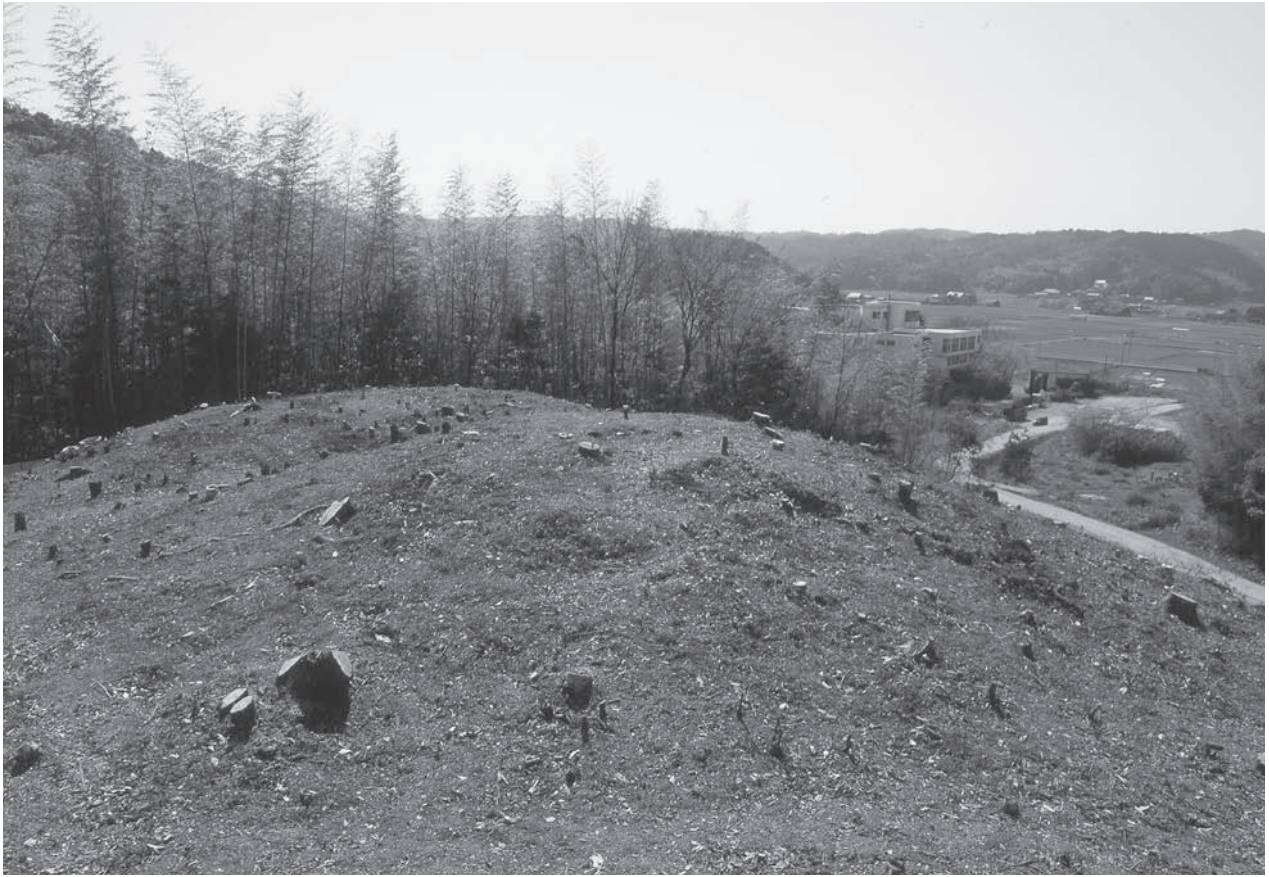
1. 21号墳(左奥)・22号墳(中央)調査前状況(東から)