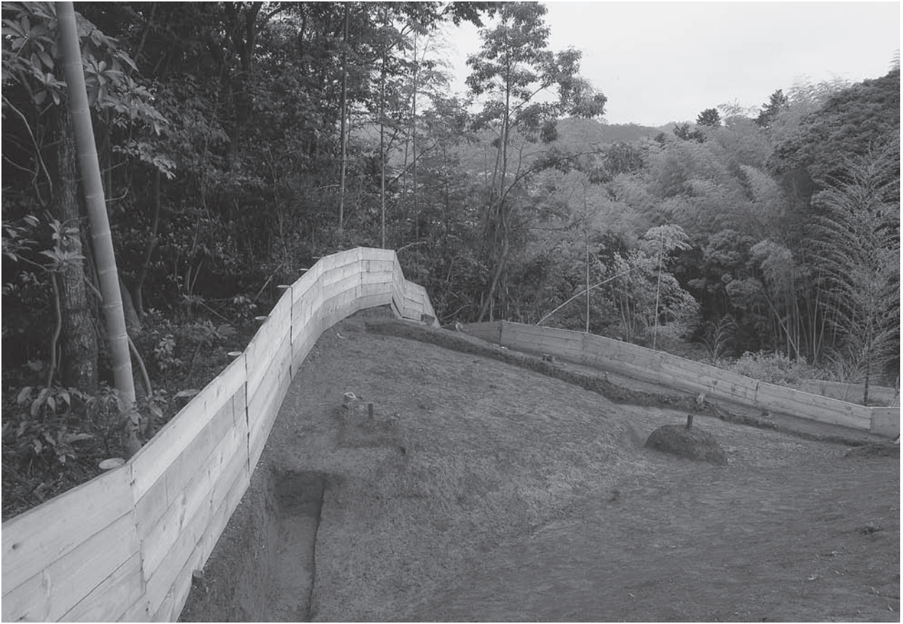
1. 20号墳墳丘検出状況(東から)