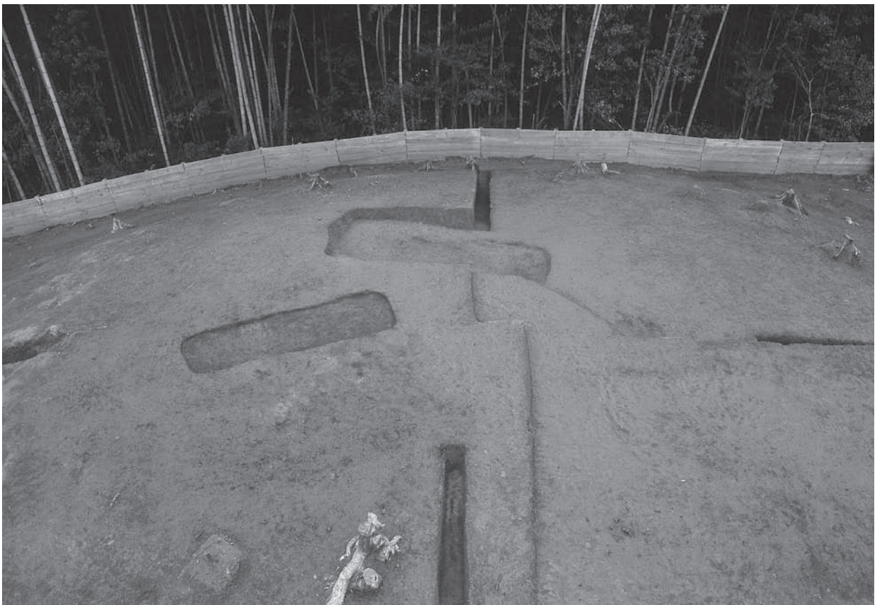
2. 21号墳第1主体部(奥)・第2主体部(手前)完掘状況(北から)