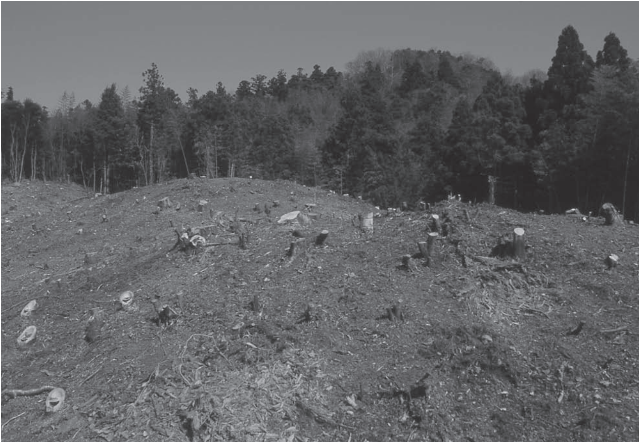
1. 23号墳(手前)・27号墳(中央)調査前状況(西から)