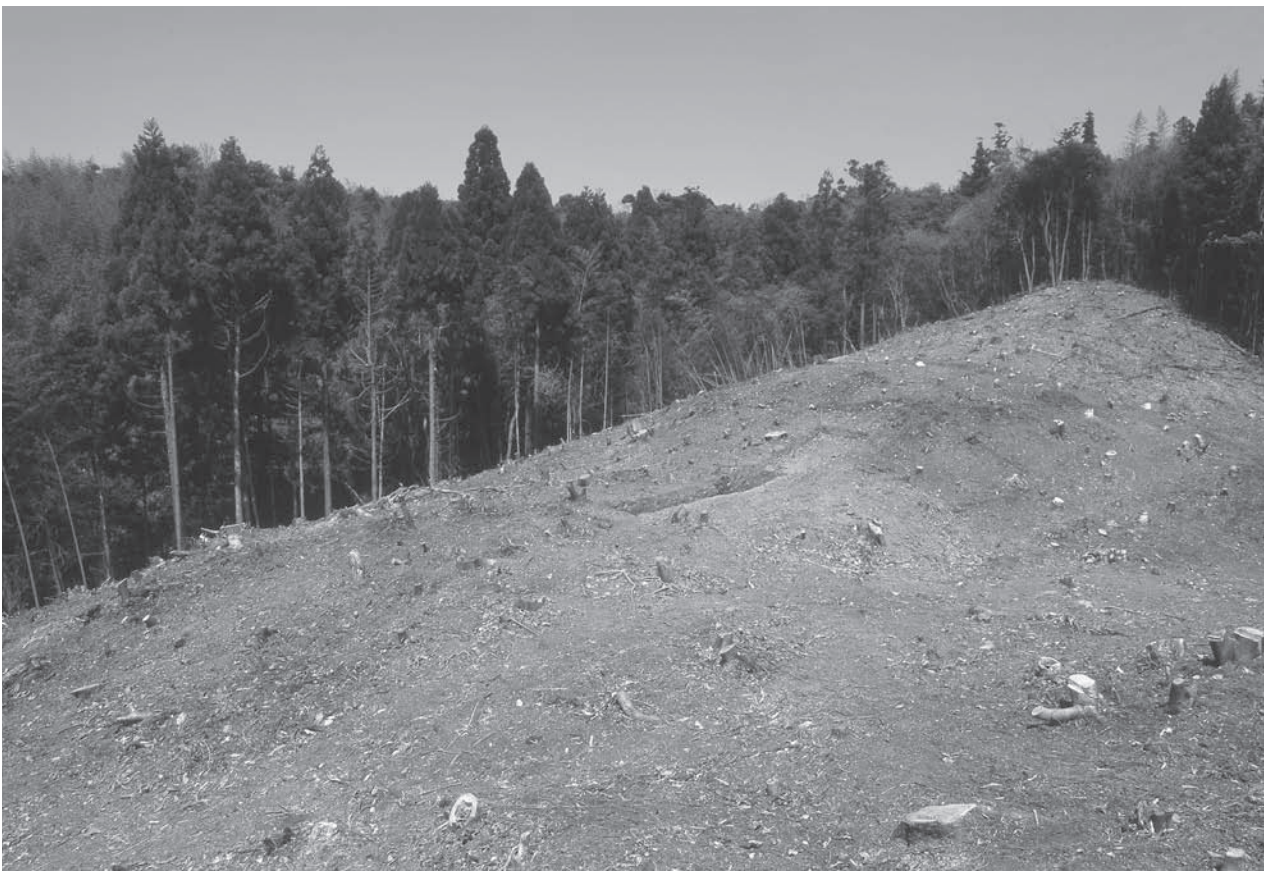
2. 24号墳(左)・25号墳(右奥)調査前状況(南西から)