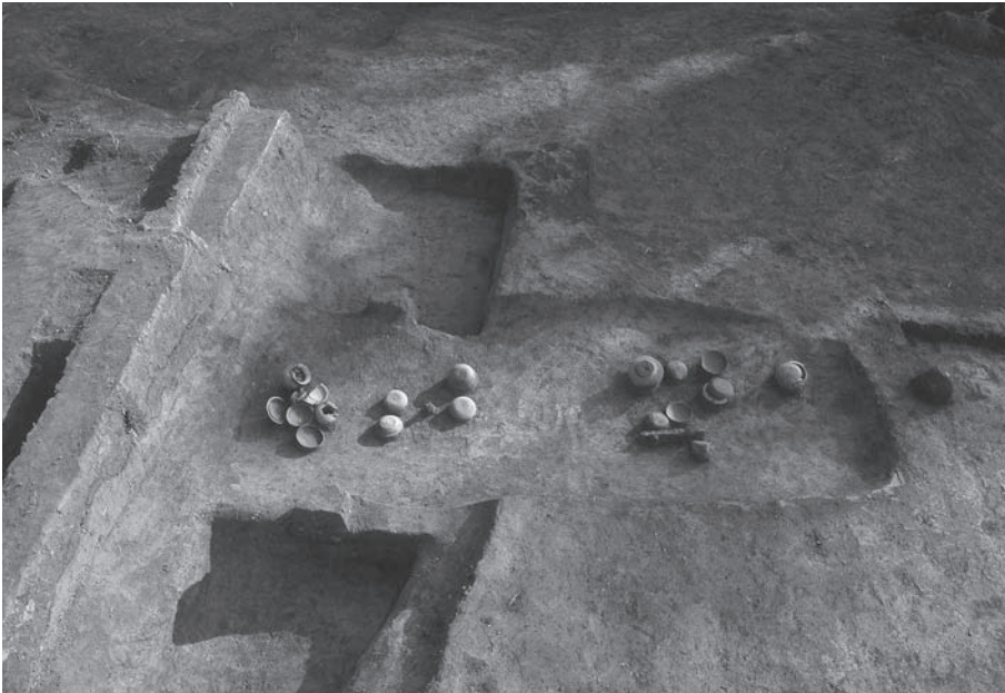
1. 21号墳第3主体部遺物 出土状況(北から)