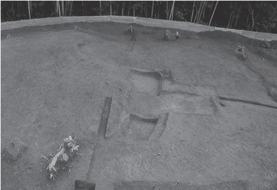
1. 21号墳第3主体部完掘 状況(北から)