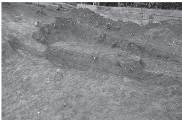
3. 21号墳古段階西側周溝土層断面(北西から)