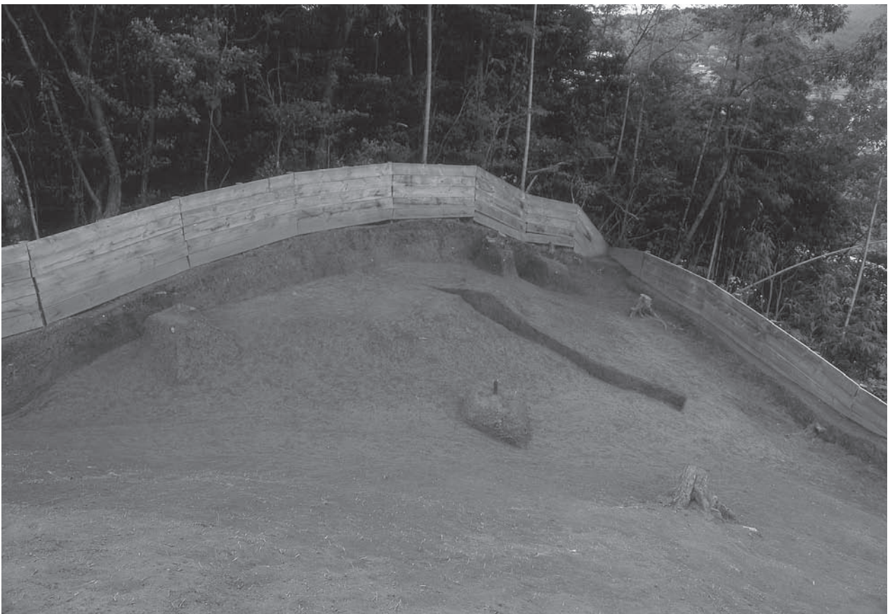
2. 20号墳完掘状況(北東から)