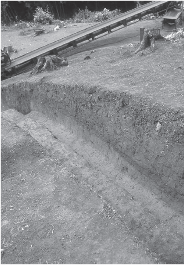
1. 21号墳西側断ち割り(南東から)