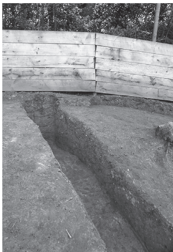
3. 20号墳断ち割り(北東から)