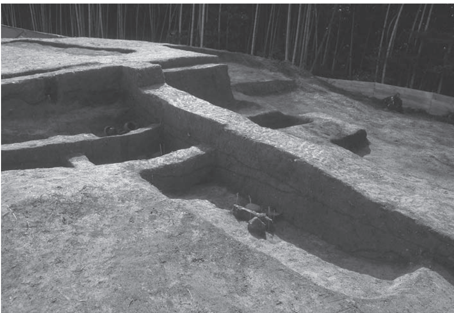
3. 21号墳第3主体部土層 断面(北西から)