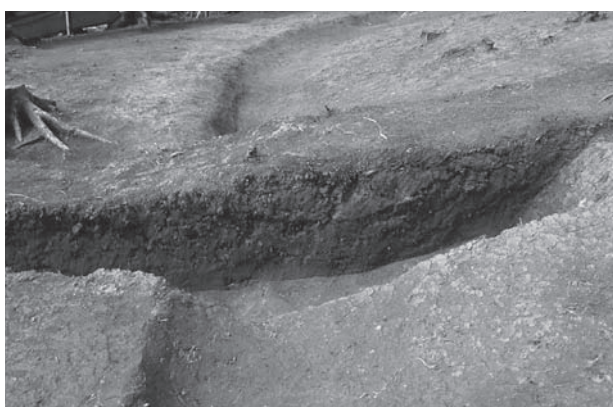
2. 21号墳新段階西側周溝土層断面(南から)