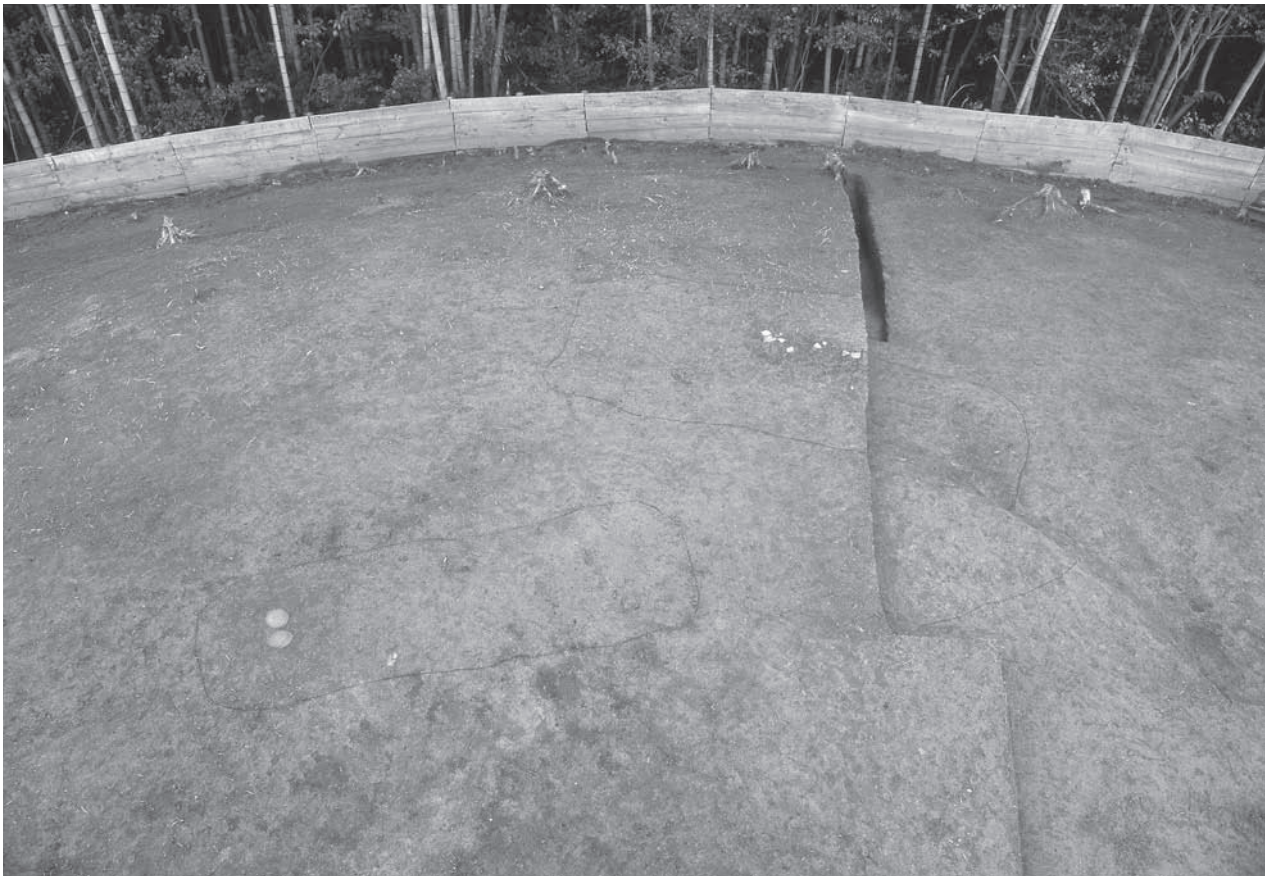
1. 21号墳第1主体部(奥)・第2主体部(手前)検出状況(北から)