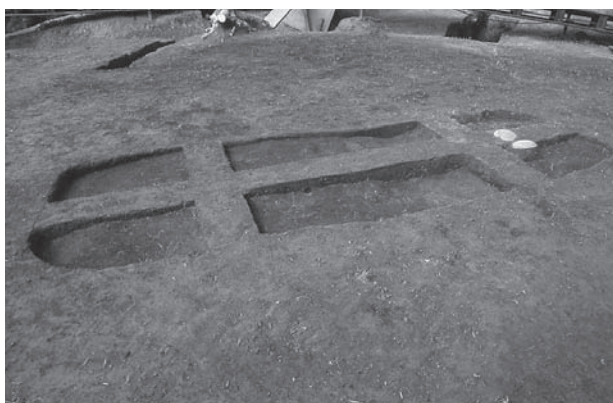
3. 21号墳第2主体部土層断面(南から)