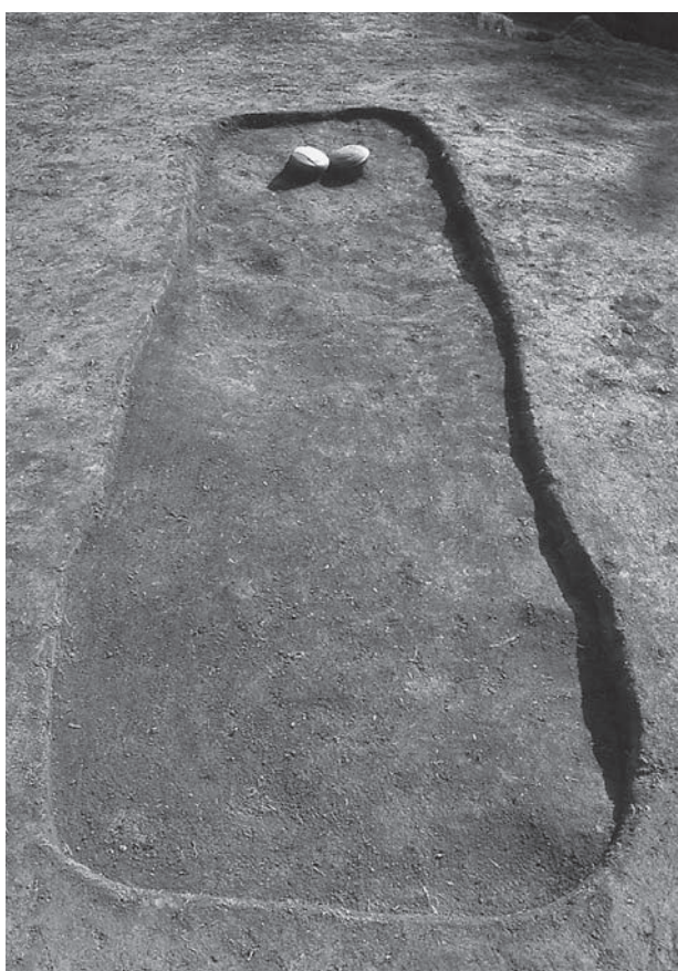
4. 21号墳第2主体部遺物出土状況(西から)