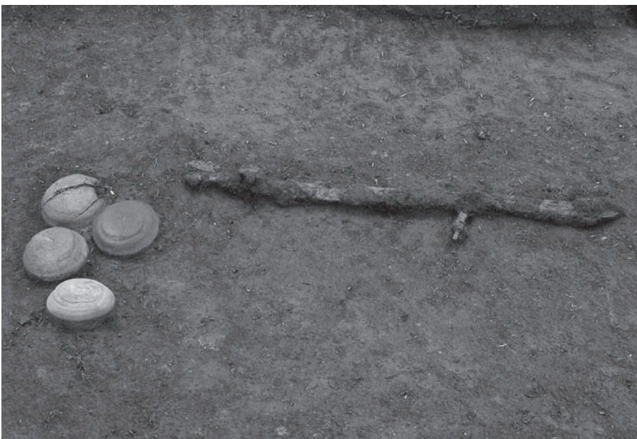
3. 21号墳第1主体部遺物出土状況(北から)