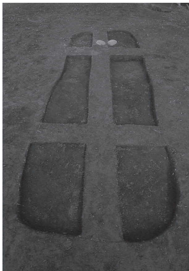
2. 21号墳第2主体部土層断面(西から)