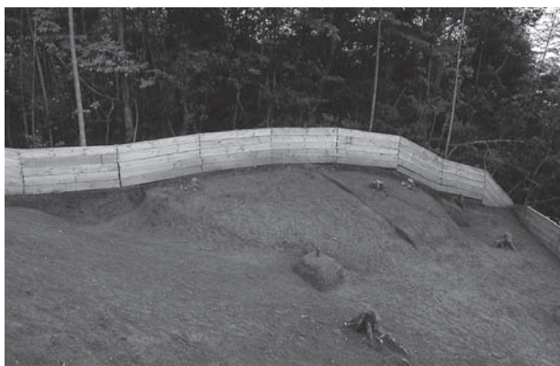
4. 20号墳盛土除去後(北東から)