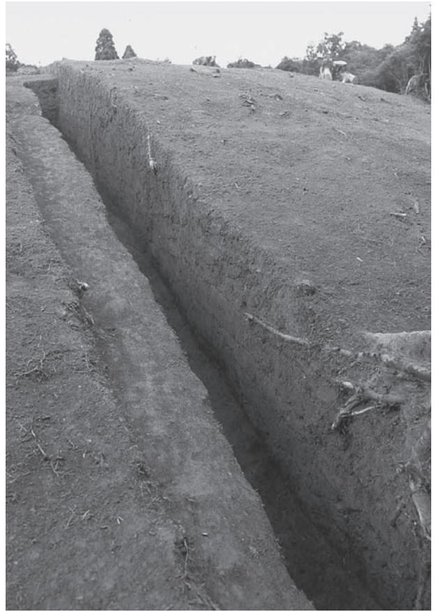
2. 21号墳南側断ち割り(南西から)