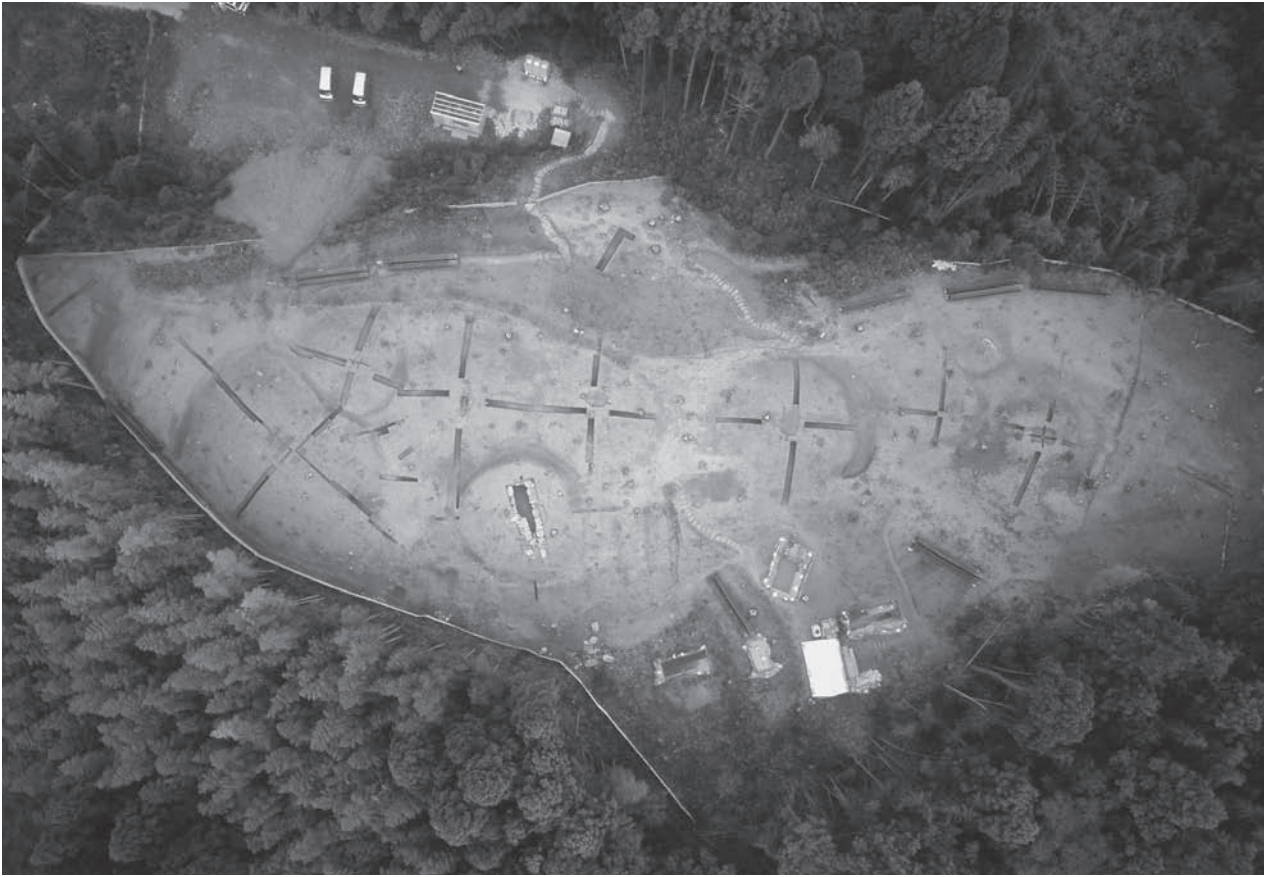
1. 古墳群全景俯瞰(写真上方が北)