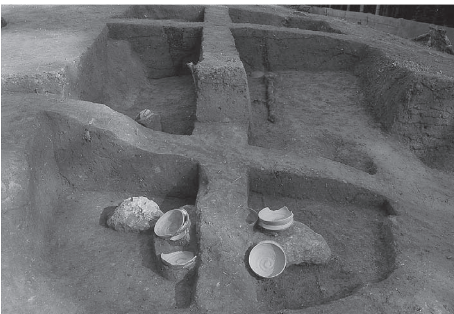
3. 21号墳第1主体部土層 断面(西から)