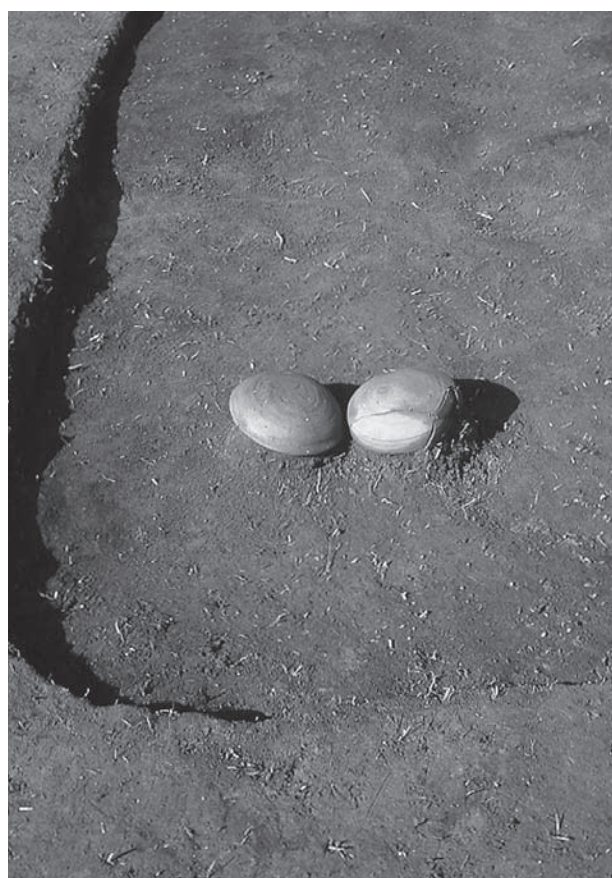
5. 21号墳第2主体部遺物出土状況(東から)