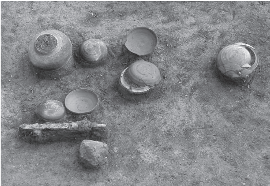
2. 21号墳第3主体部遺物 出土状況(西半 北から)