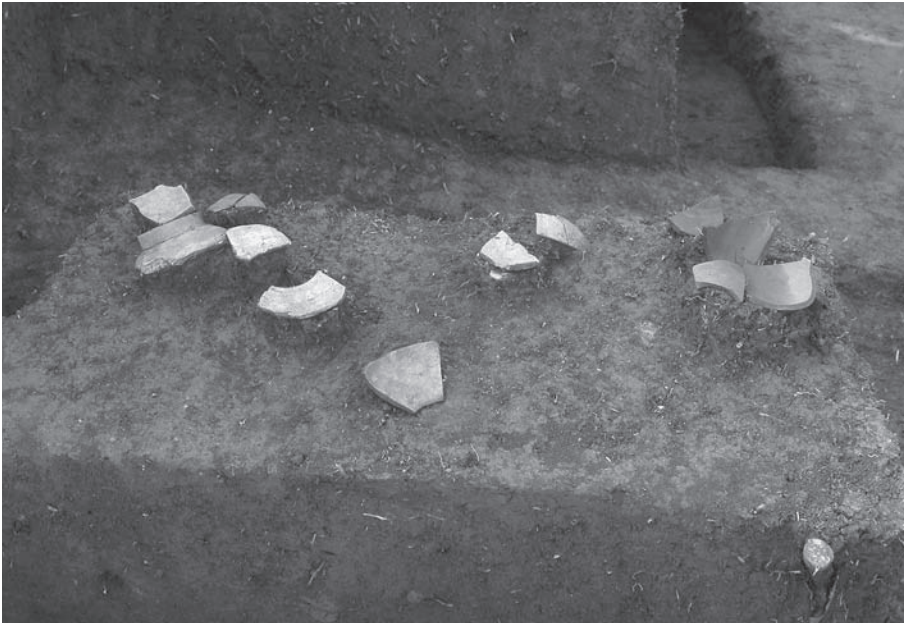
1. 21号墳第1主体部棺外遺物出土状況(北から)