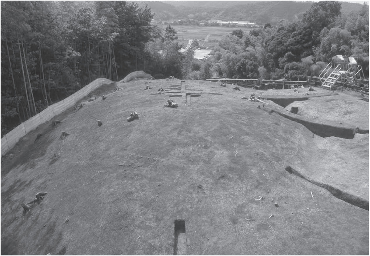
1. 21号墳新段階墳丘検出状況(東から)