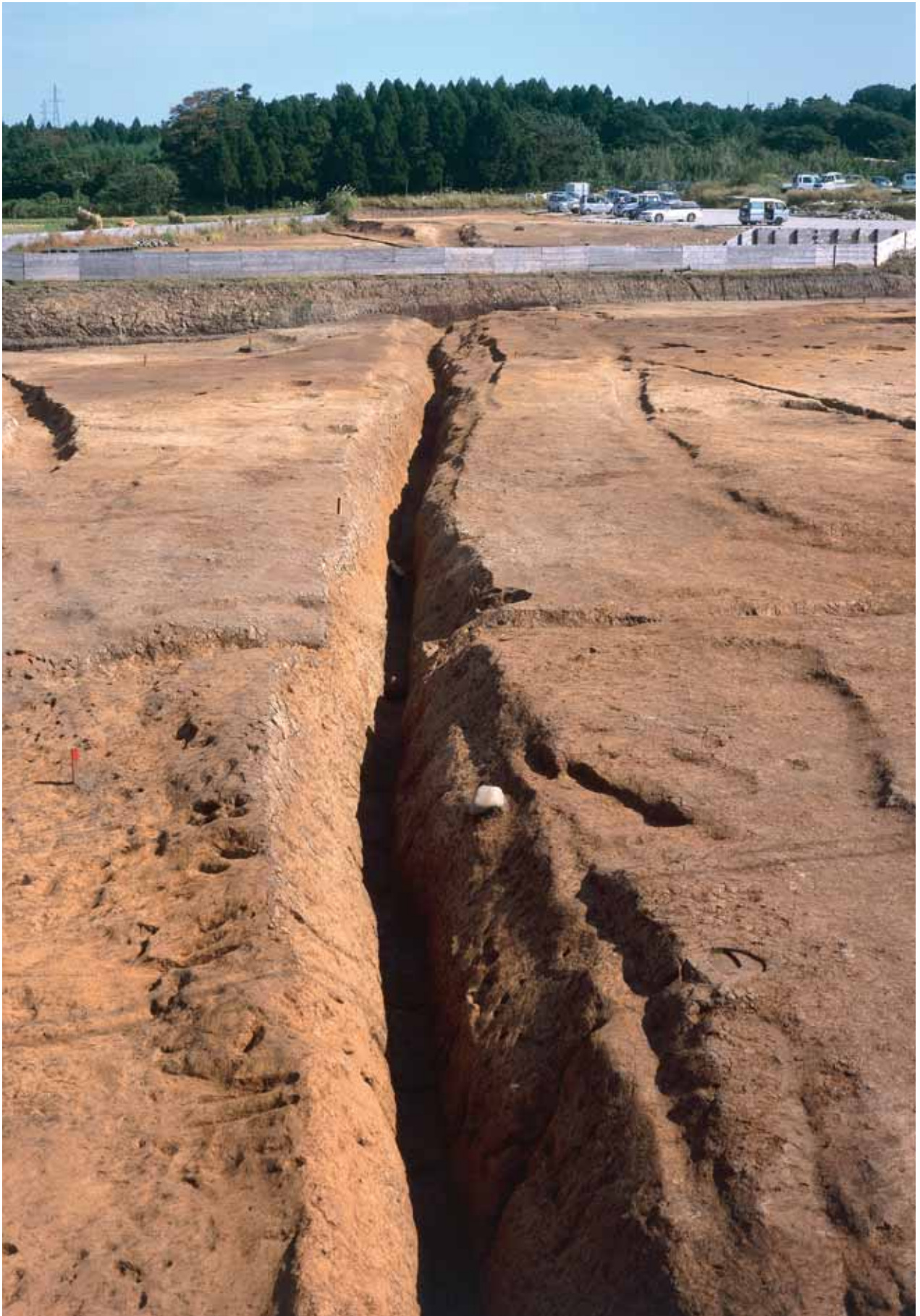
堀SD18完掘状況(西から)