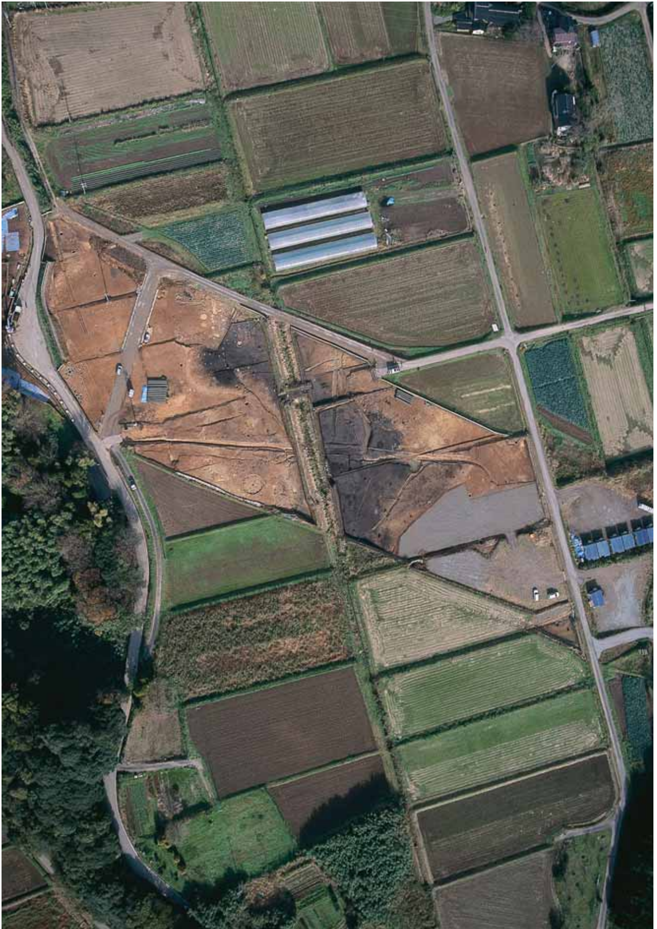
調査区遠景(調査後：上空から)