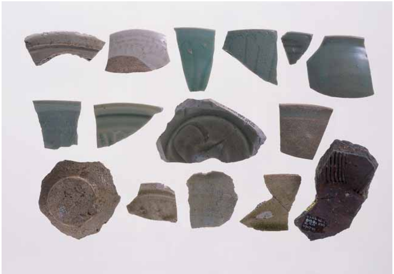
1 遺跡内出土輸入陶磁器他