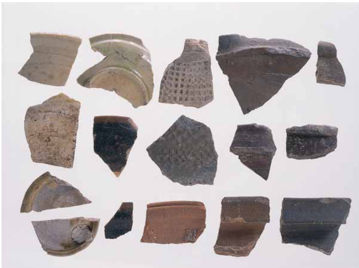
2 遺跡内出土国産陶器