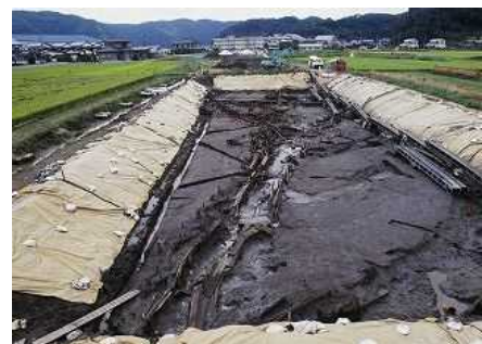
第1次調査(平成11年度)で検出された溝状遺構 ※今年度調査区は写真右側に位置

現地には駐車場がありません。青谷上寺地遺跡展示館を御利用ください。(現地まで徒歩15分)