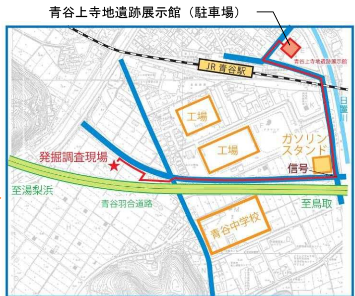
青谷上寺地遺跡発掘調査箇所と青谷上寺地遺跡展示館(駐車場)位置図