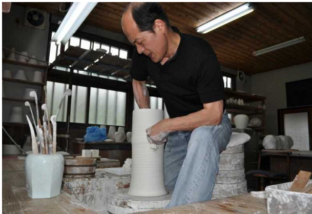
ろくろによる成形