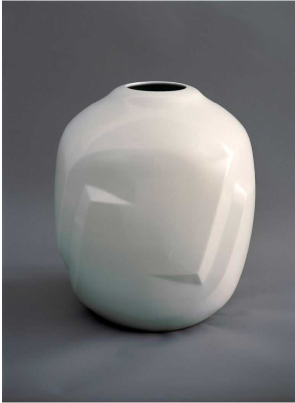
白瓷面取壺 1991 鳥取県立博物館所蔵 第11回日本陶芸展毎日新聞社賞