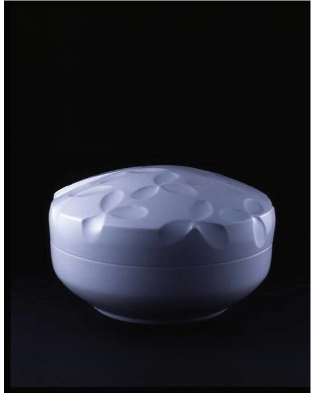
白瓷刻文蓋物 1993 鳥取県立博物館所蔵 第48回新匠工芸展富本賞