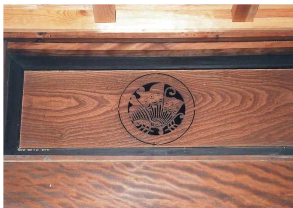
欄間に施された池田家家紋