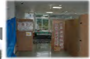
(関西広域連合事務所 7月撮影)