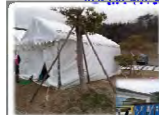
(関西広域連合事務所 3月撮影)