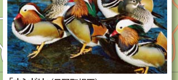
「オシドリ」(日野町根雨) 秋から春にかけて、鳥取県の鳥・日野町の鳥に指定されているオシドリがたくさふ飛来します。MAP G-5