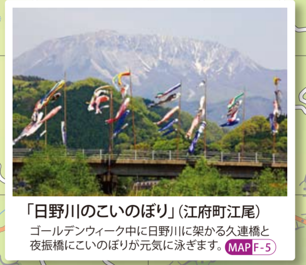
「日野川のこいのぼり」(江府町江尾) ゴールデンウィーク中に日野川に架かる久遠橋と夜桜橋にこいのぼりが元気に泳ぎます。MAP F-5