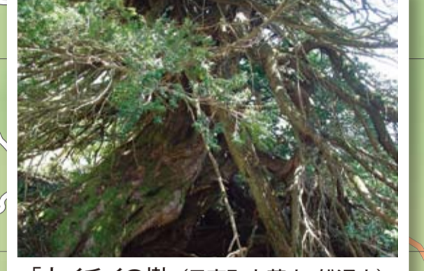
「大イチイの樹」(日南町上萩山、船通山) 国指定天然記念物の樹齢1,000年を超えるといわれ、船通山のシンボルの存在。MAP I-2