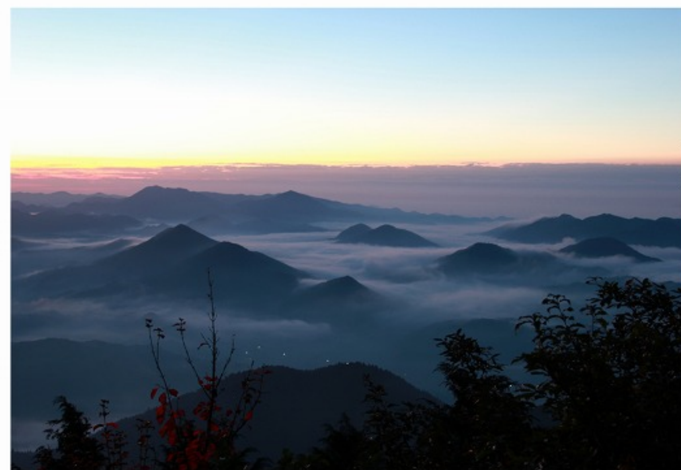
きりんざん 鬼林山 P1~P4