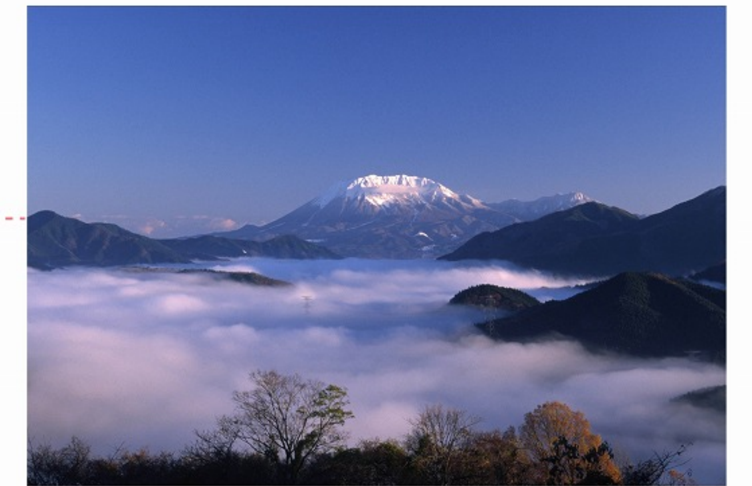
あけちとうげ 明地峠 P9~P12