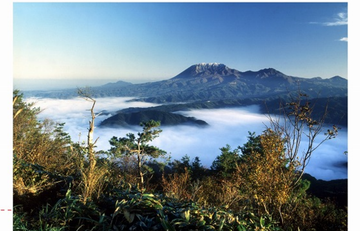
またの 俣野サージタンク(毛無山) P13~P16