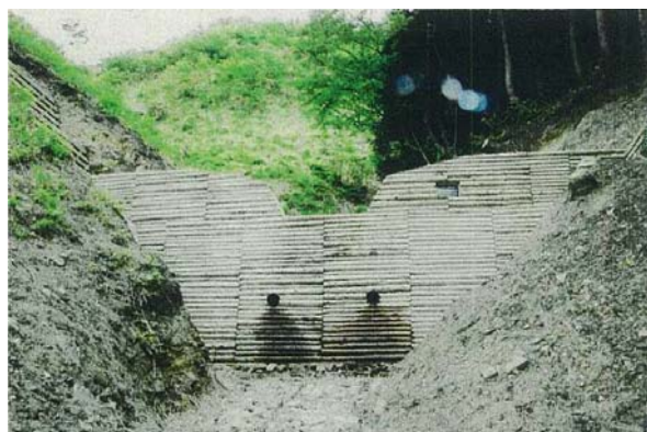
若桜町春米（中詰材はコンクリート）