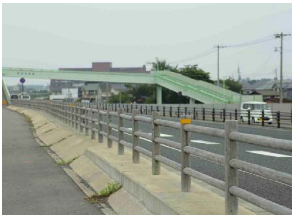
主要地方道 秋里吉方線