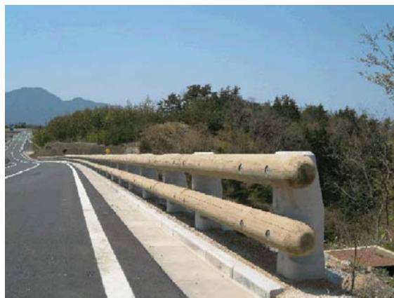
一般県道 大山上福田線