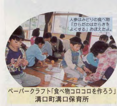
ペーパークラフト「食べ物ココロを作ろう」 溝口町溝口保育所