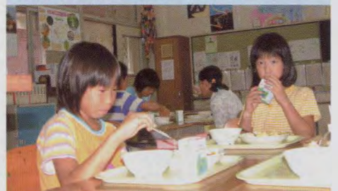
学校給食を通して食育 日南町日野上小学校