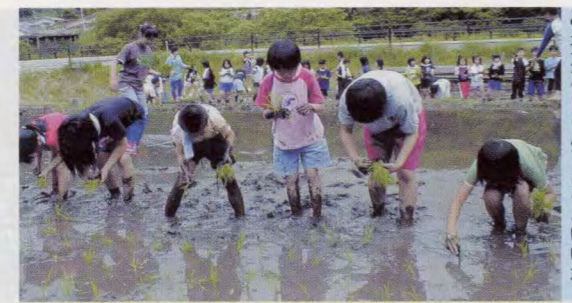
農業体験学習「水稲を育てよう」 日野町根雨小学校