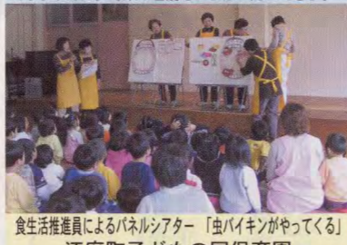
大きな口だなあ。チョコレート食べると虫歯になってしまうんだ。野菜の名前もいっぱい知ってるよ。 食生活推進員によるパネルシアター「虫バイキンがやってくる」 江府町子どもの国保育園