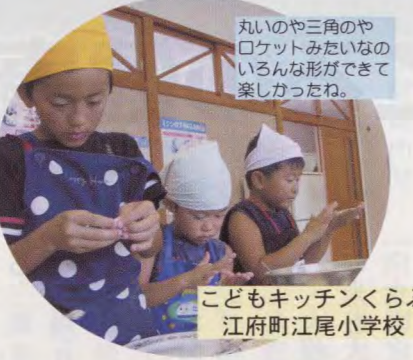
子どもキッチンくらぶ 江府町江尾小学校