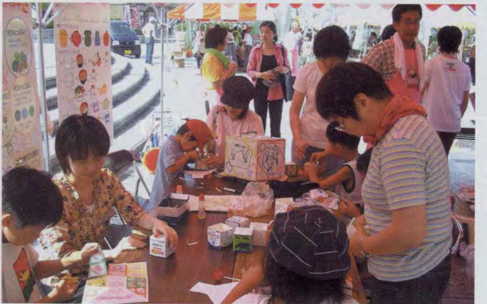
平成16年7月24日食育コーナー 米子駅前だんだん広場