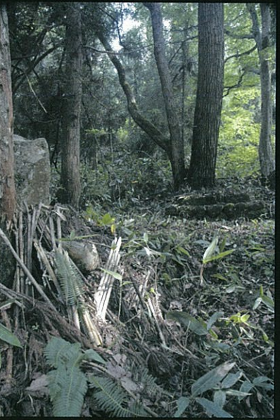
いまでも祀られる金屋子神