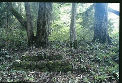
金屋子神社の台座と大木