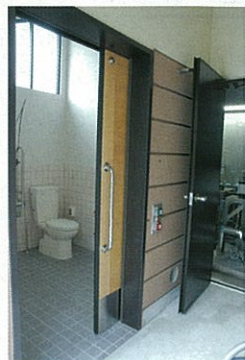
車椅子での使用も可能