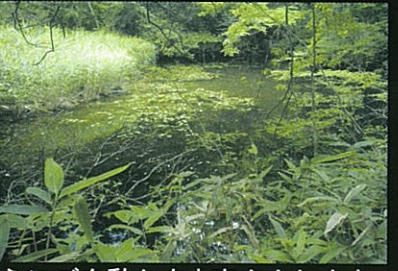
ふいごを動かす水車をまわす水を貯えた溜池