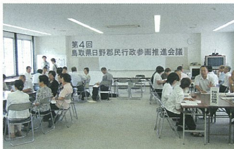
フロアーミーティング様子写真

今回の会議では、個々の委員の関心のあ るテーマについて集中して議論できるよう に、個別のブース(総合事務所各局、教育 関係、黒坂警察署)でのフロアーミーティ ングで県の説明を受けられ、それを基に全 体会議で県の考え方について委員同士の意 見交換が行われました。