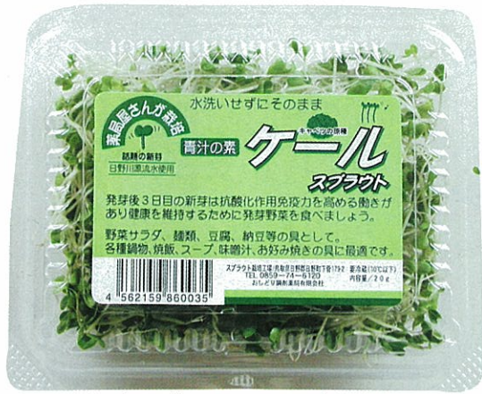
日本で唯一ケールスプラウト