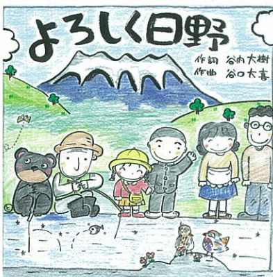
よろしく日野のジャケット表紙です! (絵: 日野町在住 音田豊美さん)