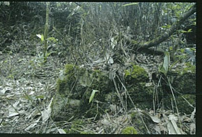
鉄で栄えた往時をしのばせる石垣