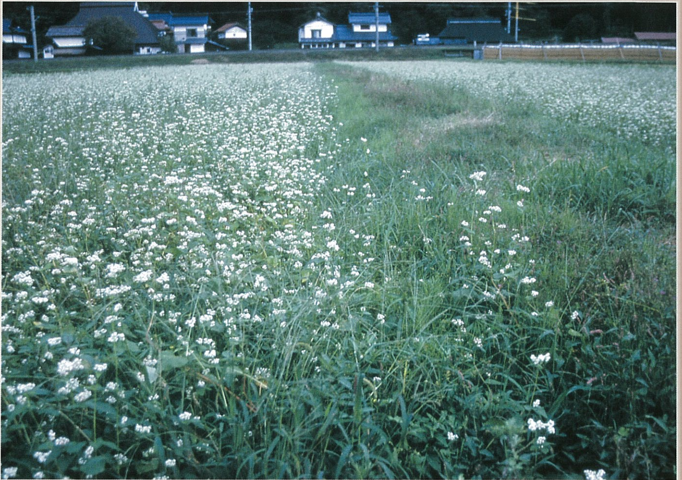
平成16年度「日野郡そばの花のある風景フォトコンテスト」金賞受賞作品 米子市 石井盛夫氏 「そば咲く上菅」