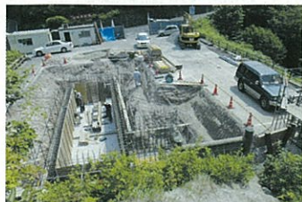
駐車場地下に浄化槽設置