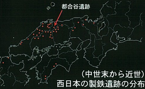
(中世末から近世) 西日本の製鉄遺跡の分布

草刈をしながら林道を行き都合谷川を渡るとタタラ跡のある杉林に出る。明治期の11年間、根雨の近藤家によってタタラが経営された。タタラ場には、高殿という製鉄工房があり、「村下(むらげ)」と呼ばれる総責任者のもと、靴を踏む「番子(ばんこ)」、鍛冶大工、砂鉄を採取する鉄穴(かんな)師、炭を焼く「山子(やまこ)」などの技術者集団およそ百数十人が集落をつくり生活した。 タタラ場にはタタラの神、通常は金屋子神が祭られた。この神は一般的には女神であり、犬、鳶、麻、そして人間の女を忌むといわれ、仕事場へは女性を入れなかったという。この集落は山内(さんない)といい周辺の農村とは違う独自の社会を作っていた。米、酒、酢などの食料品は周辺の農村から購入しており、地元の産物の一大消費地でもあった。また農閑期の冬場になると上菅などの集落から鉄穴流しに稼ぎに出ていた人もいた。・・・「奥日野三千軒はタタラで食べていた」という言葉が残っている。 この山内集落は木の伐採により炭焼きにする木が供給できなくなると次なるたたら場へと移っていった。都合谷たたらのは明治期には鳥取県の和鉄生産額が全国の4割を占めるに至った。ここの神社跡ではいまも初冬の荒神様の季節になると畑集落の人々がお祀りをしているという。