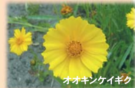
オオキンケイギク