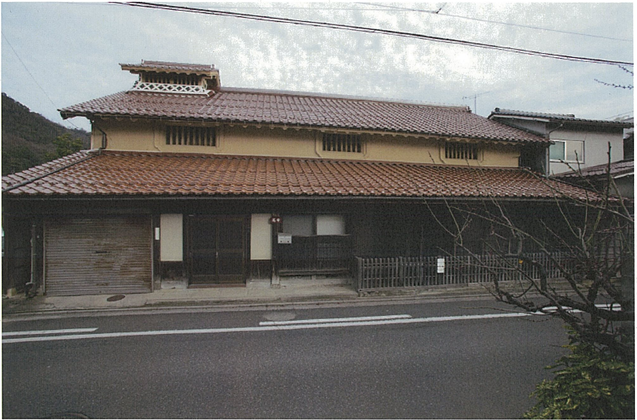
岩田家住宅主屋外観