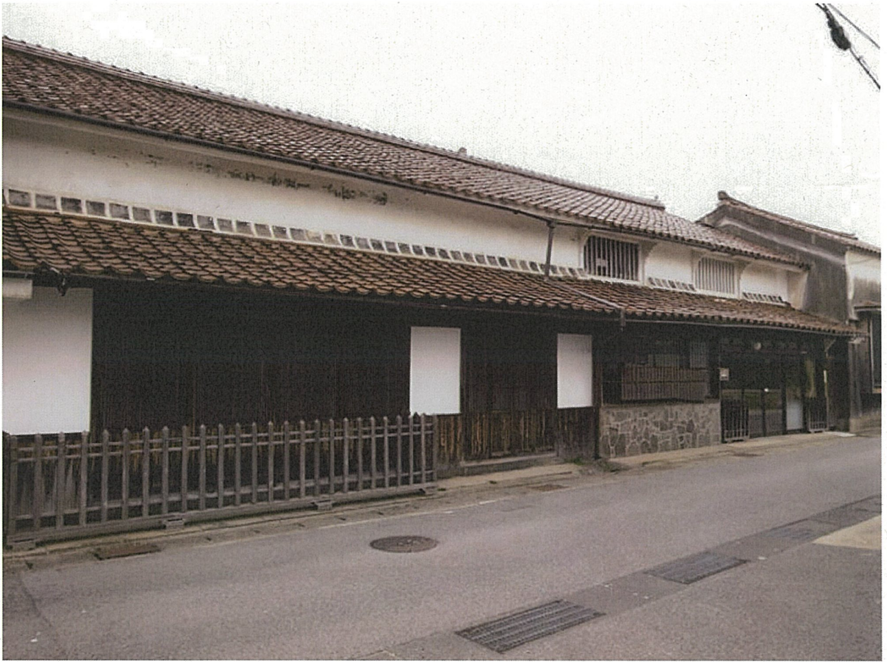
面谷家住宅店舗兼主屋 外観