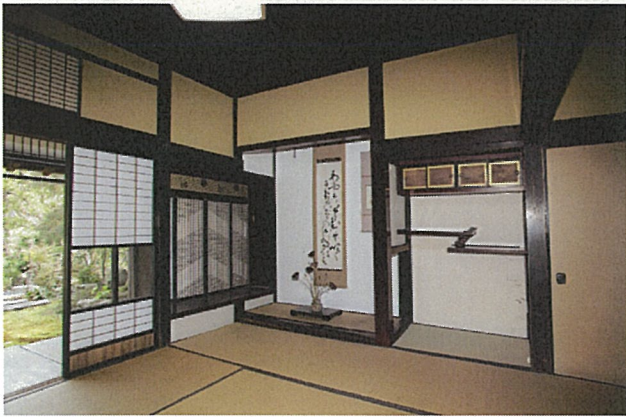
岩田家住宅主屋 座敷