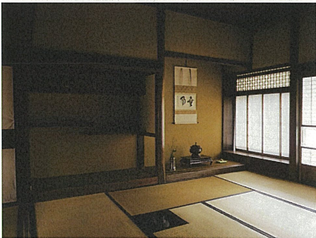
面谷家住宅店舗兼主屋 座敷