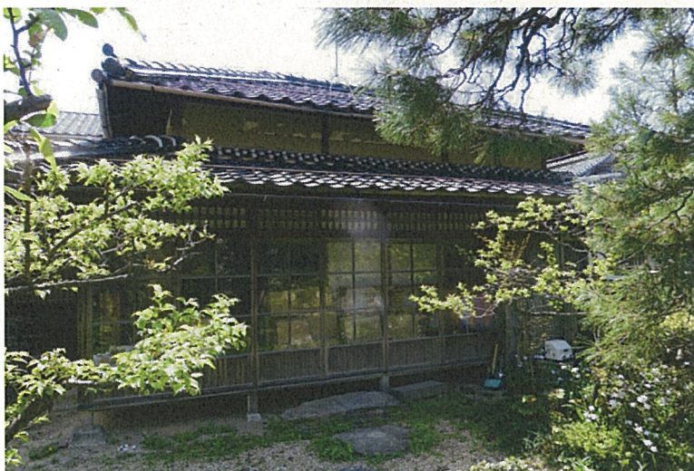
岩田家住宅離れ 外観