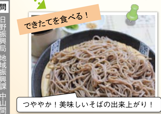
できたてを食べる! つややか!美味しいそばの出来上がり!