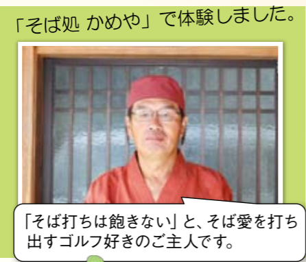
「そば処 かめや」で体験しました。「そば打ちは飽きない」と、そば愛を打ち出すゴルフ好きのご主人です。

日野郡産そば粉とおいしい水を使って打つそば。最初から最後まで気を抜けない奥深さも魅力の一つ。自分で打ったそばは格別です!