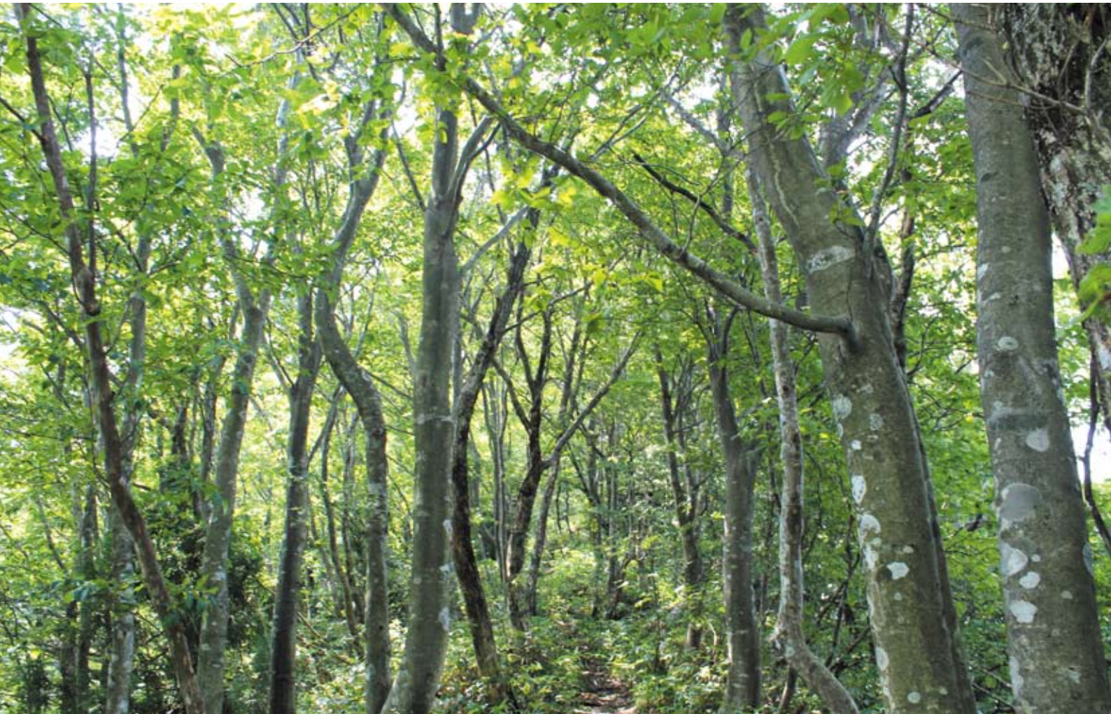
写真:毛無山ブナ林(江府町)