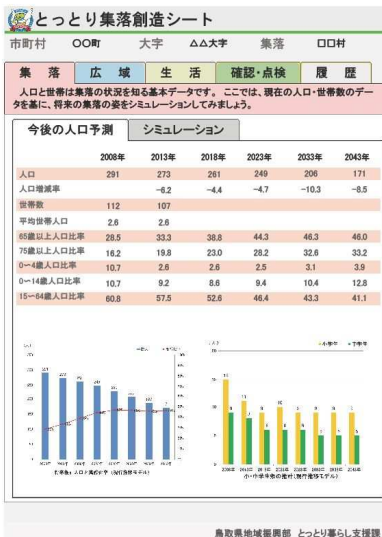
鳥取県地域振興部 とっとり暮らし支援課 集落(人口推計)

人口減少や過疎化・高齢化が進む中山間地域では、集落の将来を心配する方も多いでしょう。集落創造シートでは、集落の現状と将来の姿をしっかりと把握するためのツールです。将来の集落の姿をイメージして、地域づくりを進めましょう。