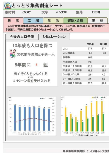
鳥取県地域振興部 とっとり暮らし支援課 集落(シミュレーション)