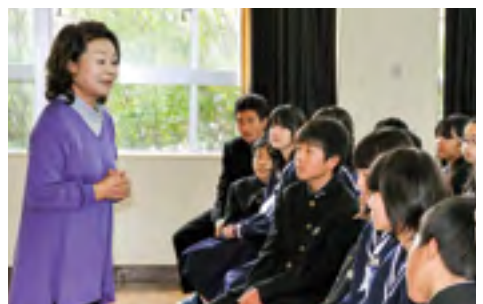
▲人権講演会で角さんの話聞き入る中学生

もっとあいサポートのバッジを付けた人が増えていき、究極の目標はあいサポートのバッジやあいサポート運動がいらなくなって、自然に誰もが助け合い、障がいのある人も社会、地域の中に溶け込んでいるそんな姿がこのサポート運動の先にあれば良いと思いますし、そうあるべきだと思います。