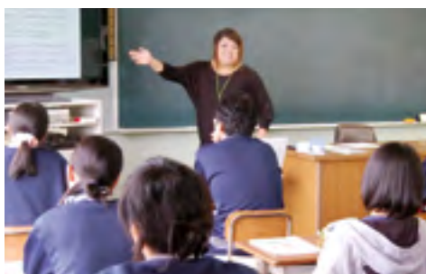
▲学生を対象にした「あいサポーター研修」

福祉サービスやさまざまな制度を利用して生活は豊かになりません。やはり、一番近くにいる隣近所の住民や「元気？」と声をかけてくれる地域の人、困ったときに「何か手伝いましょうか」と手を差し伸べてくれる人たちの支えは不可欠です。1人でも多くの人にあいサポーター研修を受けてもらい、障がいに対する理解や関わり方を知っていただくことで、共に分かり合い、支え合うことができると思います。1人の力は小さいですが、みんなが同じように考えたら地域の大きな力になると思います。