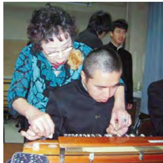
▲公民館の大正琴教室「琴扇芳の会」のメンバーと一緒に琴を奏でる浜田養護学校の生徒

新規福祉事業を模索していたとき、職員数人があいサポート研修を受講した。障がいを知り、共に生きる地域社会を目指す素晴らしい運動に共鳴し、公民館の主要事業に加えた。2年の強化期間を設定し、2012年度より取り組んでいる。