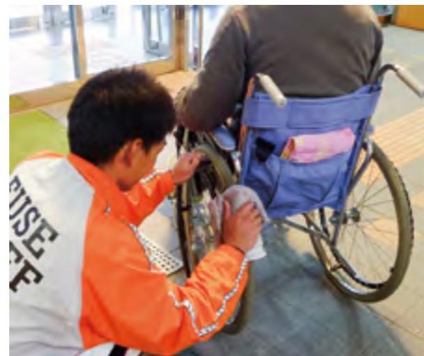
▼車椅子はロビーに常備。タイヤを拭き、そのまま館内に入れるよう誘導する