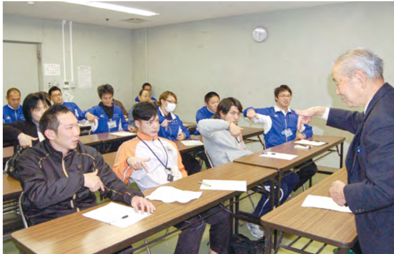
▲聴覚障がい者への理解とコミュニケーションの向上を図るため職員を対象にした独自の手話講習会を開いている