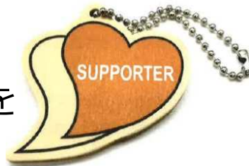
あいサポートキッズストラップ