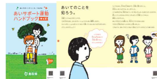
学習用教材 (あいサポート運動 ハンドブック キッズ版)